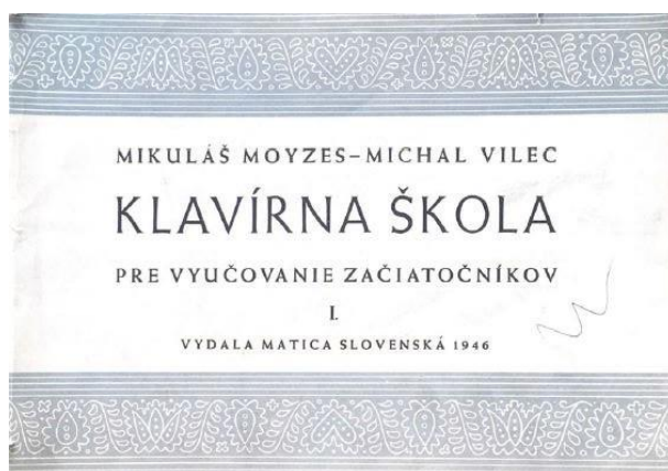
Obrázok 4 Titulná strana, Klavírna škola pre začiatočníkov I., 1946