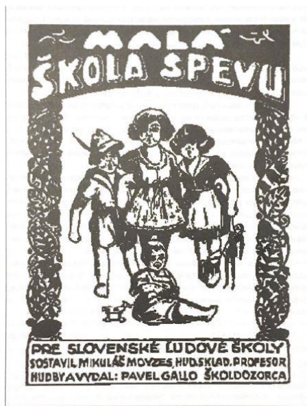
Obrázok 2 Malá škola spevu, Titulná strana, 1924

„ Malá škola spevu – autorova skromnosť je vyjadrená aj na titulnom liste slovom sostavil a nie vytvoril “ F. Matúš 2007