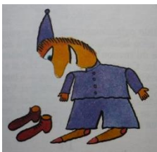
Ilustrace k pohádce ze souboru Houpací pohádky (1987)

(Alois Mikulka: Aby se děti divily, 1961)