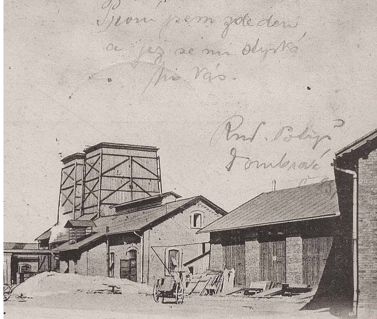
Dombrau, österr. Schlesien. Dąbrowa — Dombrova.