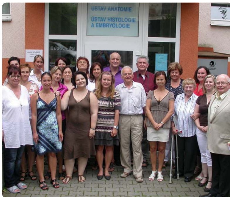
Účastníci a organizační a zkušební tým kurzu Gynekologická cytodiagnostika.