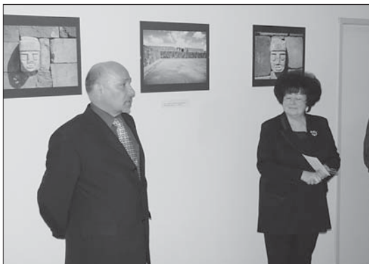
ZE ZAHÁJENÍ VÝSTAVY TITICACA, PERU, BOLÍVIE

A Titicaca? Od poloviny 90. let působím na katedře historie Filozofické fakulty v Olomouci. Dlouhodobé badatelské zaměření olomoucké univerzity historické práce představuje historický místopis Moravy. Model historického místopisu, který je po desetiletí v Olomouci úspěšně aplikován, lze přenést a uplatnit i v jiném prostoru. Zvolil jsem s ohledem na svou iberoamerikanistickou specializaci prostor jezera Titicaca. Ten je výjimečný jednak svými geografickými a přírodními