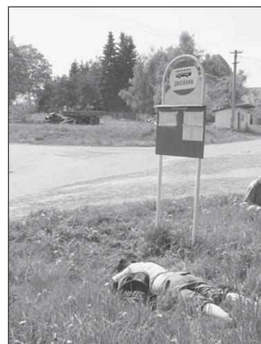
BYL AS I NA ZASTÁVKU A ODPOČINEK