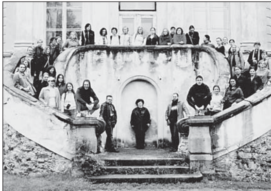
ŽIVÉ SOCHY V ARCHITEKTU E ŽELIVU

Dle mého názoru byl vikendový výlet po stavbách Santiniho výborný, p edevším lov k získá zcela jiný pohled na dílo i autora, když se s nimi osobn seznámí. Sama baroko p íliš v oblib nemám, hlavn ne radikální baroko s „p eplácanými“ interiéry, kde nem že žádný prvek sám o sob vyniknout, protože je p ebit hned jiným – dle mého názoru. P ebohatá barokní výzdoba, kdy vedle sebe stojí už samo o sob radikální a výrazné architektonické len ní, pozlacení všeho možného, um lý mramor a vsudyp ítomná výmalba... Proto