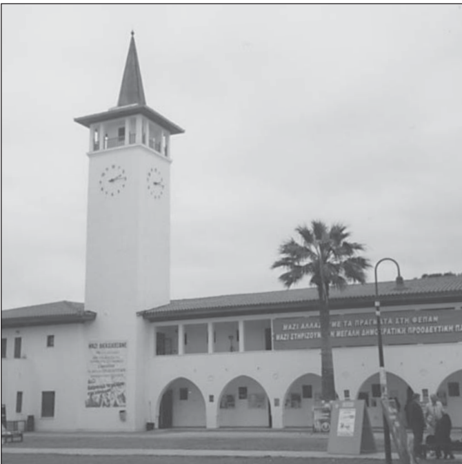
KYPERSKÁ UNIVERZITA V NIKÓSI

STANISLAV KOLÁ KATEDRA ANGLISTIKY A AMERIKANISTIKY