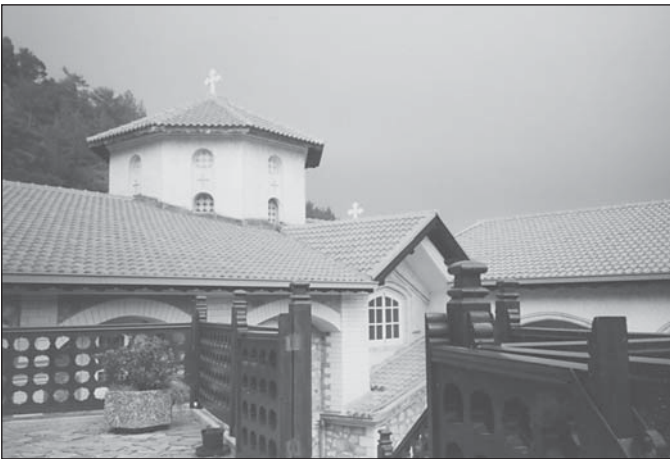
KLÁŠTER KYKKOS V POHO Í TROODOS

Kakopetrii. Poho í Troodos je však proslulé p edevším svými pravoslavnými kláštery a my jsme navštívili nejv tší a nejslavn ější z nich, Kykkos, s p ekrásnými mozaikami. M li jsme i p íležitost obdivovat krásné skalnaté pob eží St edozemního mo e na jihu ostrova. Je spjato s kultem bohyn lásky Afrodité a nám asi nejvíce uvízne v pam ti Petra tou Romiou, místo, o n mž se íká, že je jejím rodišt m, nebo podle staré legendy práv tam krásná bohyn vystoupila z mo ské p ny. Chmurnou realitu rozd leného ostrova jsme si uv domili v samotné Nikósii p i p echodu z ecké do turecké ásti m sta p es nárazníkové pásmo vojsk OSN. V turecké ásti jako bychom se ocitli ve zcela jiném sv t , což jsme si uv domili zvlášt na orientálním tržišti. V Larnace, p ímo ském letovisku vystav ném na starov kém m st Kition, kde podle pov stí dožil sv j život po svém vzk íšení Kristem svatý Lazar, jsme nemohli vynechat prohlídku byzantského kostela svatého Lazara (Agios Lazaros), a neodolali jsme ani koupání ve vlnách St edozemního mo e. Po naší dlouhé ladovské zim jsme si to pat i n užili. Na slunném Kypru jako bychom p esko ili jedno ro ní období a ocitli se rázem uprost ed léta. Za dva roky n co takového nebude možné. P íští konference evropských amerikanist t se totiž koná v Norsku.