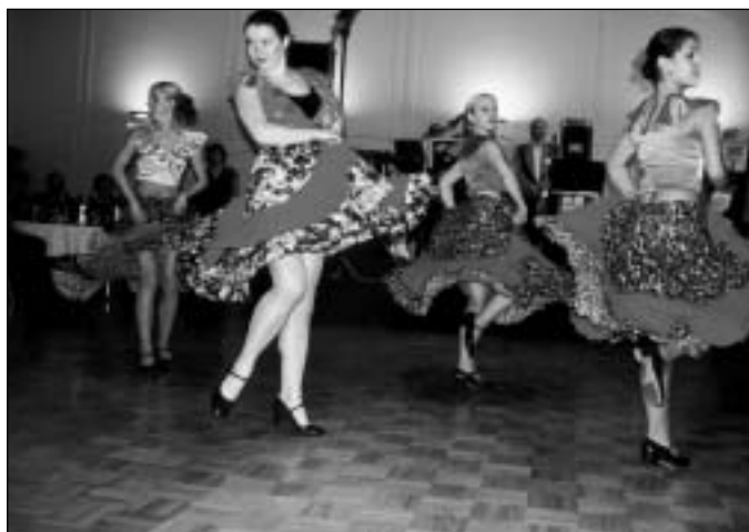
PLES ZAHÁJILY TANEČNICE Z JANÁČKOVY KONZERVATOŘE