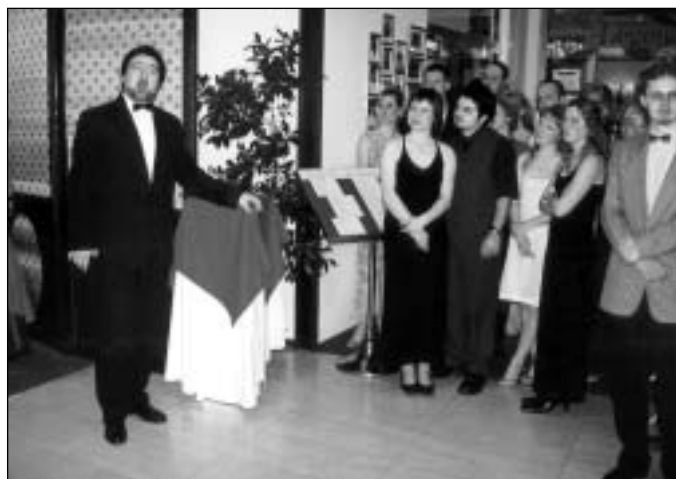
JAROSLAV DVORSKÝ PŘI SVÉM VYSTOUPENÍ