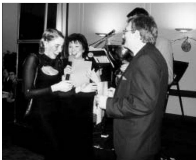
ŠTASTNÁ VÝHERKYNĚ PŘEBÍRÁ CENU REKTORA