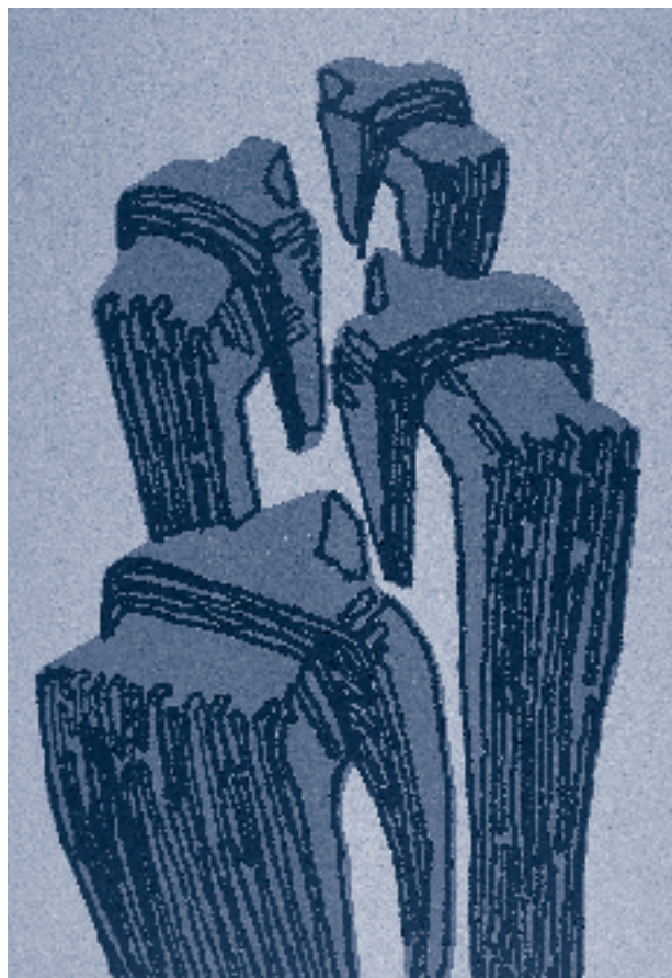
Malá galerie studentů Ostravské univerzity Grafiky Michala Žížky (IPUS - výtvarný obor)