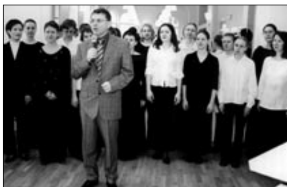
PŘEDSEDA POSLANECKÉ SNĚMOVNY PČR L. ZAORÁLEK