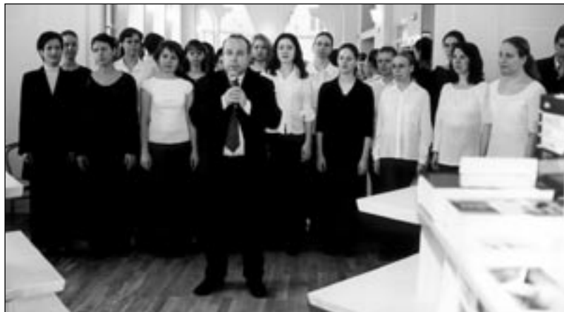
PRIMÁTOR OSTRAVY ALEŠ ZEDNÍK