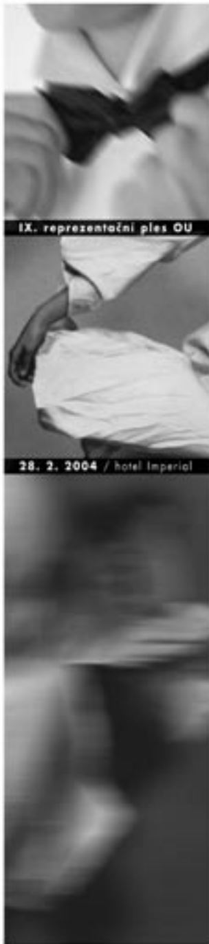
IX. reprezentační ples OU