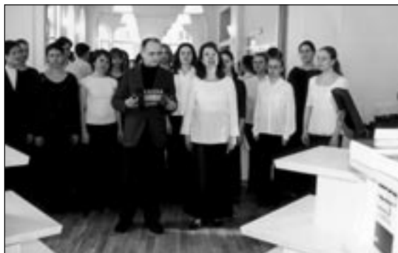
NA SLAVNOSTNÍM ZAHÁJENÍ PRODEJE VYSTOUPIL ADASH