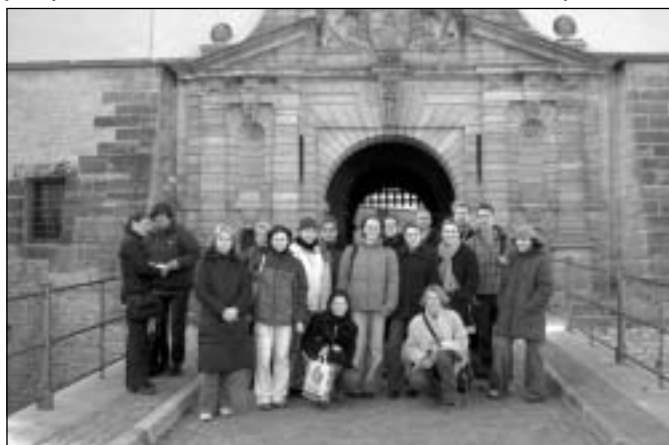
PŘED BRANAMI WARTBURGU