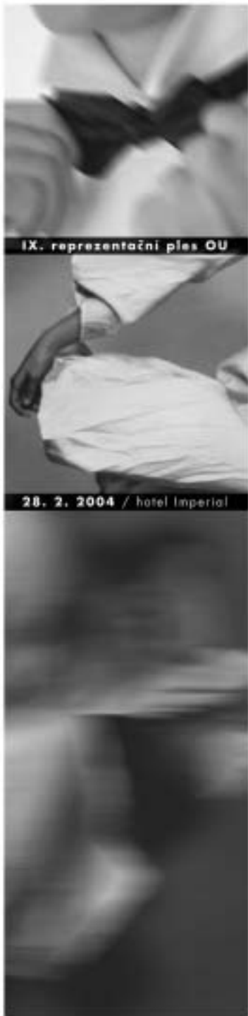
IX. reprezentační ples OU