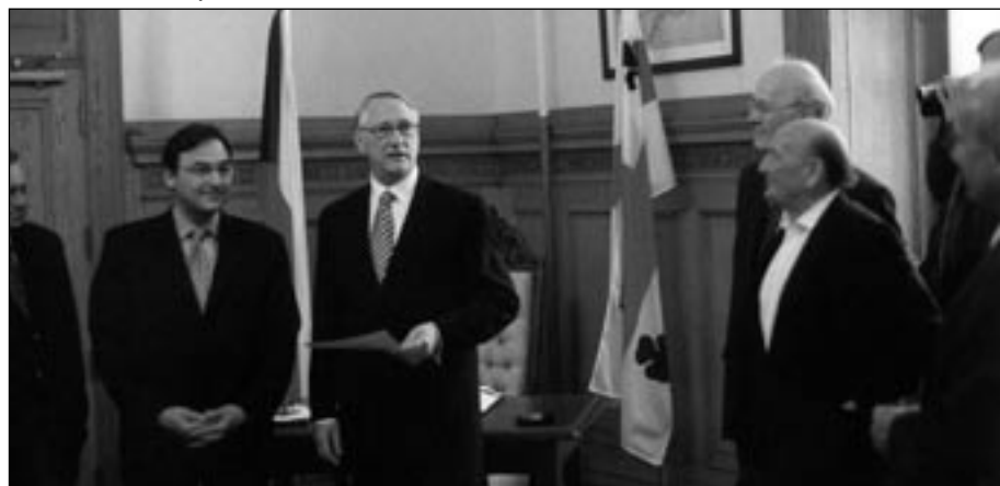
PŘIJETÍ NA RADNICI V MONTREALU (UPROSTŘED STAROSTA S MINISTRY PRO FINANCE A SPRÁVEDLNOST, VPRAVO DIRIGENT MÁTL.