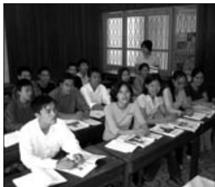
NAŠI BUDOUCÍ STUDENTI

Během návštěvy jsme navštívili hlavní město Hanoj na severu země i největší město na jihu Saigon, dnes přejmenovaný na Hočiminovo Město. Prohlédli jsme si několik tamních vysokých škol, setkali jsme