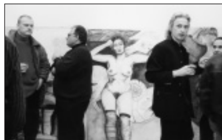
Z VERNISÁŽE VÝSTAVY