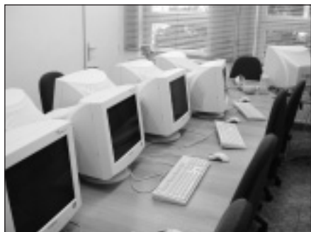
POČÍTAČOVÁ STUDOVNA NA KATEDŘE OŠETŘOVATELSTVÍ ZSF OU

V závěru roku 2002 byly díky grantové podpoře Fondu rozvoje vysokých škol (FRVŠ) dokončeny dvě nové počítačové