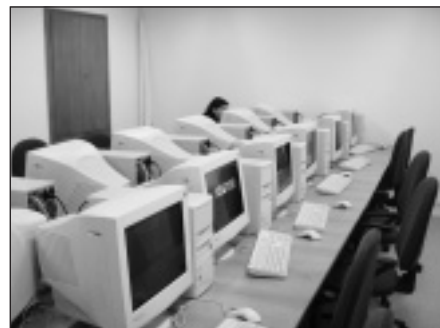
POČÍTAČOVÁ LABORATOŘ ÚSTAVU PATOLOGICKÉ ANATOMIE ZSF OU