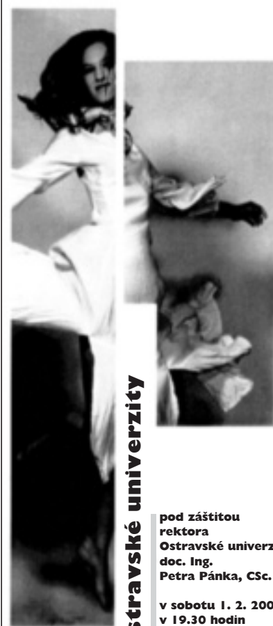
VIII. reprezentační ples Ostravské univerzity