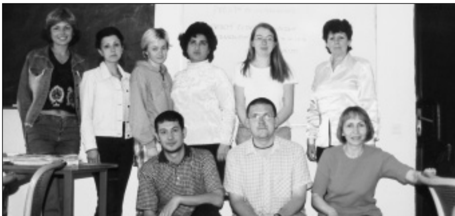
ÚČASTNÍCI KURZU ČEŠTINY

Ještě než absolventi obdrží Osvědčení o univerzitní zkoušce z českého jazyka , musí například vypracovat dvoustránkovou esej na téma Cizinec v České republice (případně Moje profese, Země, odkud pocházím apod.). Potrápí se také s diktátem z českého jazyka, musí být schopni plynule přečíst krátký novinový článek a své znalosti prověřit v násled-