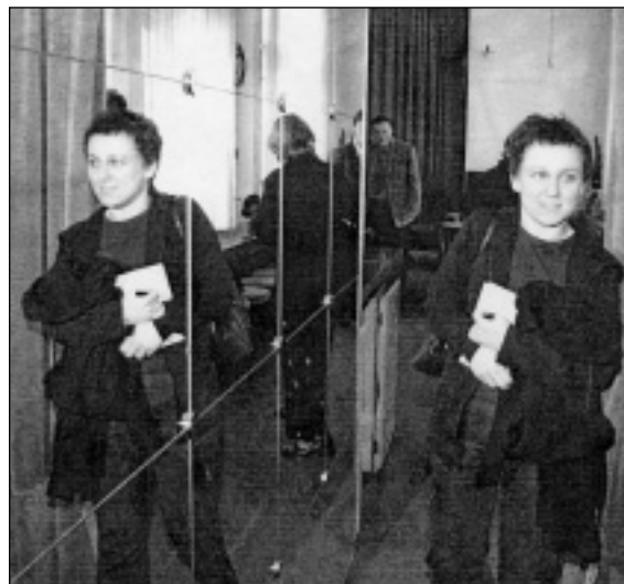
OLGA TOKARCZUK VCHÁZÍ DO ARÉNY

Zpráva o příjezdu Olgy Tokarczuk na Filozofickou fakultu Ostravské univerzity a ohlášená autogramiáda její nové knihy vydané v češtině vzbudila velký zájem masmédií. Přímo v divadle Aréna poskyto-