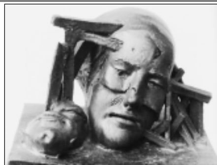
PROBLÉM-TÍHA, KERAMIKA, 1986

Po zájmu o vnitřní prostor organických tvarů a vnější prostor vegetace Vratislav Varmuža zaciluje svoji pozornost na expresivně formované figurální plastiky. Nejvíce pozornosti věnuje „nejvýraznější“ části lidského těla - obličej. Tváře, v některých případech spíše masky deformované bolestí a výkřiky z osmdesátých let, vypovídají mnohé o neradostné době svého vzniku. Kompozice svých „oltářů“ skládaných z keramických reliéfů autor často kombinuje s reálnými objekty. Plastiky s námětem lidských postav a tváří bychom mohli zasadit do kontextu umění „nové figurace“. Jde o souvislost plně reflektovanou a nikoli náhodnou, neboť problema-