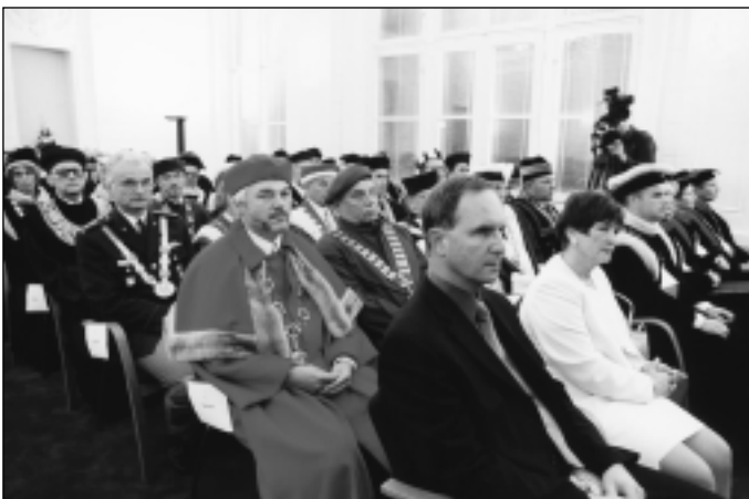
HOSTÉ SLAVNOSTNÍHO ZASEDÁNÍ VĚDECKÉ RADY