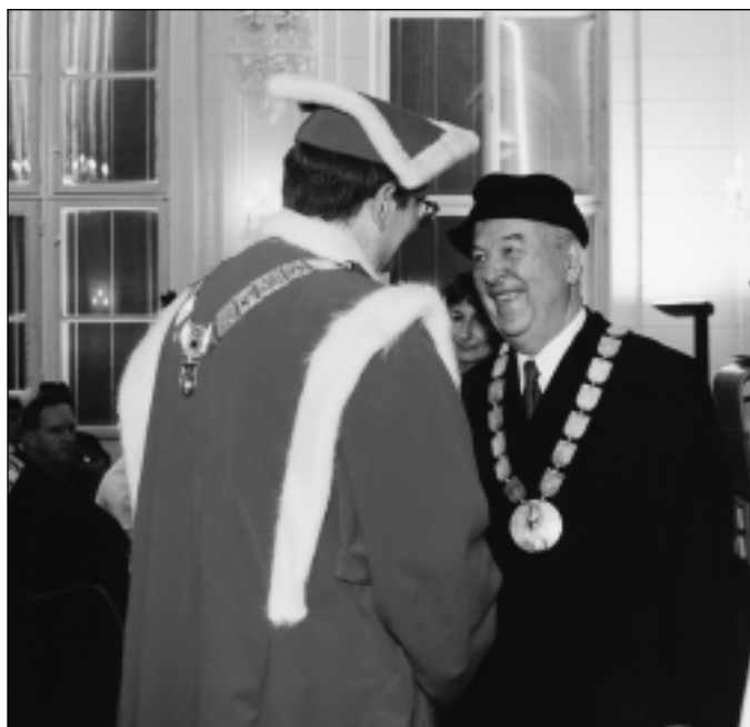
PROF. IVAN MORAVEC PŘEBÍRÁ ČESTNÝ DOKTORÁT