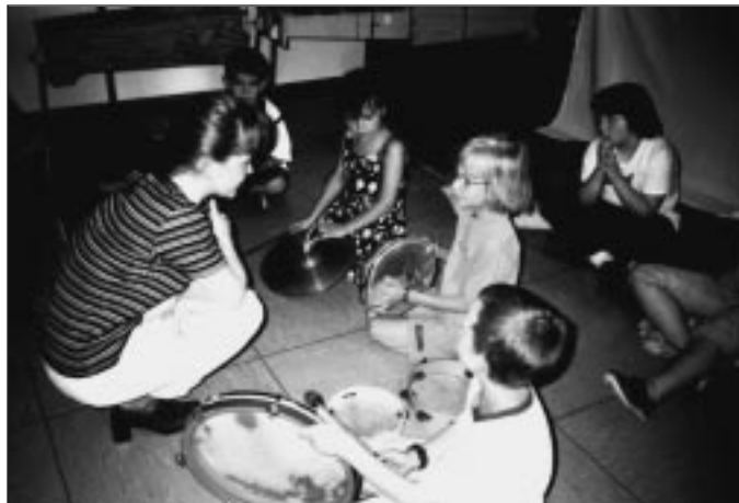
H.A.H. HOSPITACE V HODINĚ HUDEBNÍ VÝCHOVY V 1. TŘÍDĚ

Doufejme, že vybudovaných kontaktů si v příštím roce povšimne více studentů, kterým se takto nabízí možnost zajímavého studia v krásném prostředí tyrolských Alp.