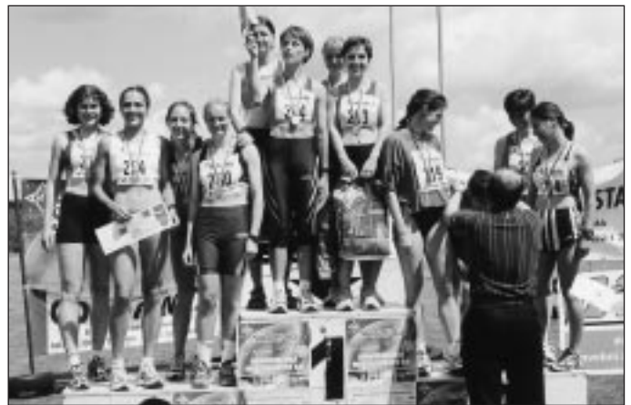
ŠTAFETA ŽEN NA 4x400 M