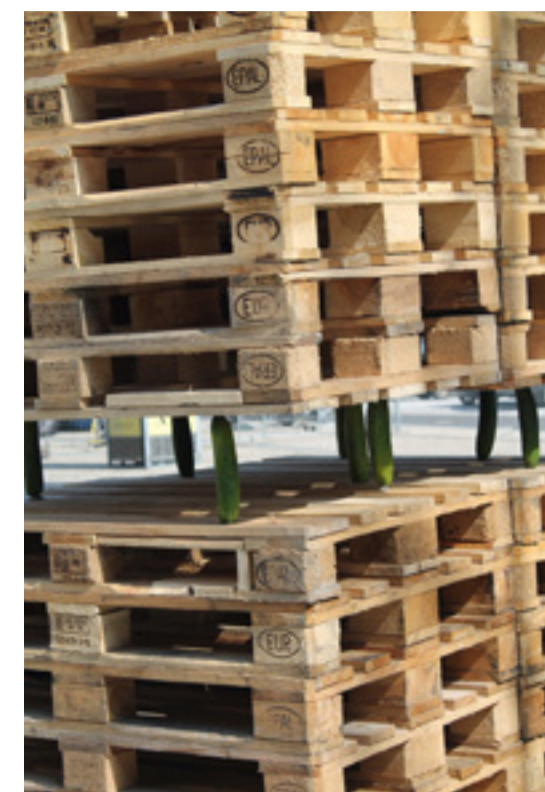
Měkké spojení - instalace z Colours of Ostrava

Zkrátka aby byli schopni o tom i přemýšlet, měli zvládnutý písemný projev a dokázali dát dohromady obraz, který má vlastní příběh.