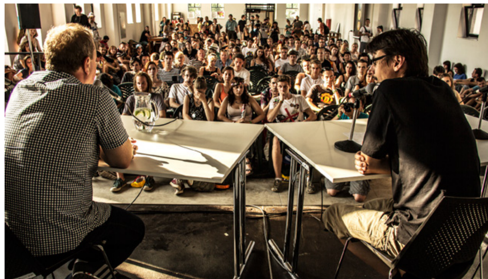
ŠLÁGR TV jako fenomén dnešní doby – jedna z přednášek Ostravské na Colours, co zaplnila diskuzní scénu.