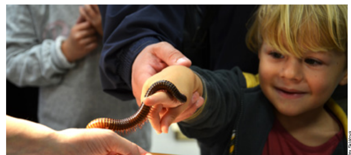
Tropická mnohonožka, oblíbený mazlíček hlavně u dětí