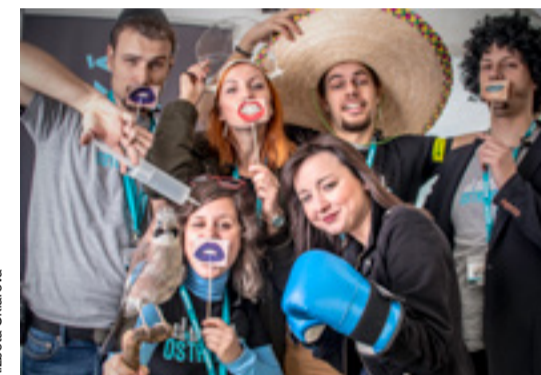
Sojka – největší hit fotokoutku