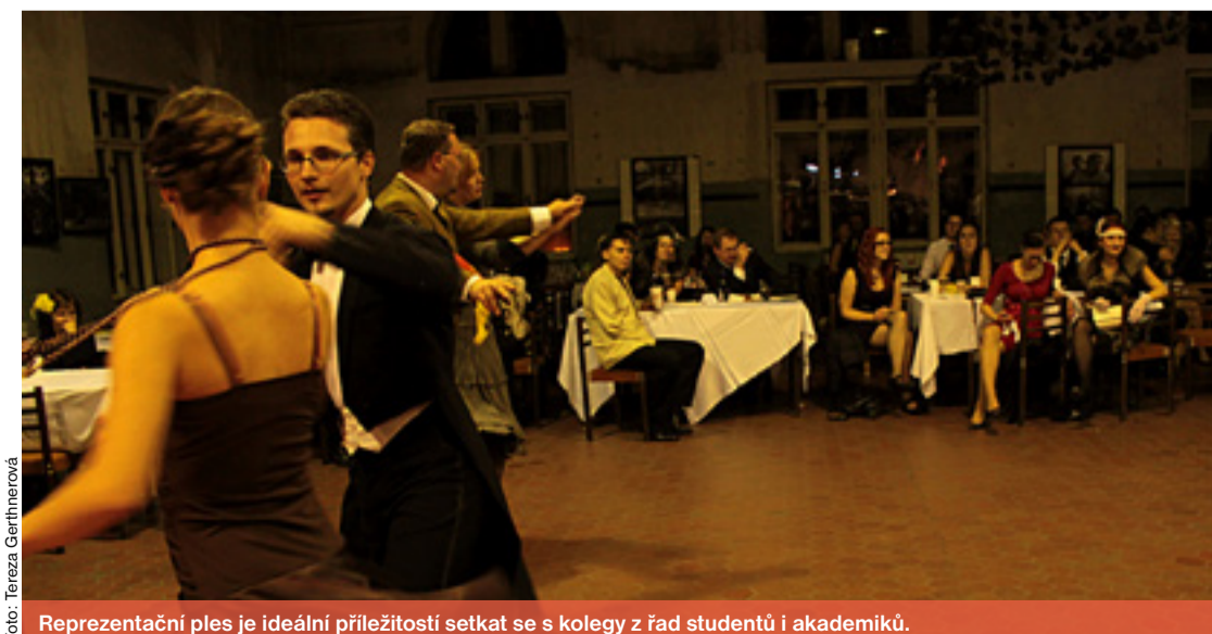
Reprezentační ples je ideální příležitostí setkat se s kolegy z řad studentů i akademiků.

těšit na dvě různé hudební scény i studentské pivo IQač. Více podrobností najdete během ledna či února na živém portálu OU@LIVE, oficiálním webu Ostravské univerzity nebo v dalším čísle tištěného Čtvrtletníku.