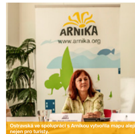
Ostravská ve spolupráci s Arnikou vytvořila mapu alejí nejen pro turisty.

„Úředníkům poslouží například při shánění peněz na ochranu přírody a krajiny, obcím k lákání turistů či rozvoji naučných stezek, turistům zase k plánování svých cest a podnikatelé tato místa mohou přijmout jako výzvu k realizaci turistických