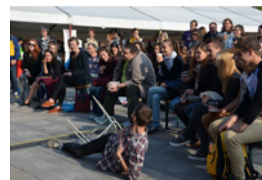
Vystoupení improvizáčního divadla ImPěčko

Letos Ostravská univerzita doslova opustila své budovy a vydala se za lidmi: kromě Colours jsme se ukázali taky na Masarykově náměstí, kde jsme rozdávali radost v rámci happeningu Jsme Ostravská!!! A to nejen středoškolákům, kteří zde měli možnost prohlédnout si všechny obory, které Ostravská univerzita nabízí a popřemýšlet, jakým směrem by chtěli sami dále pokračovat. Ale také komukoli, kdo šel kolem: čas oběda zpestřila kapela HEY!!!, studenti Lékařské fakulty OU, kteří sklídili obrovský úspěch. Potom nastoupilo ImPěčko: improvizáční herecká skupina z Ostravy, která na základě podnětů od diváků hraje krátké veselé skeče.