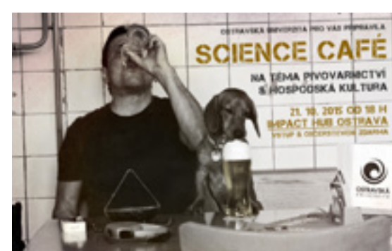
Foto: plakát akce

Příští setkání se vrátí opět k tématům, která hýbou společností. 25. listopadu bude Science Café v rukou Fakulty sociálních studií.