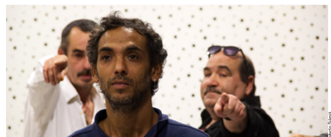
Akční skupina ASLIDO sdružuje lidi se zkušenostmi s bezdomovectvím

Už nyní se těšíme na další ročník. To nejoblíbenější zopakujeme a přidáme i mnoho nového!