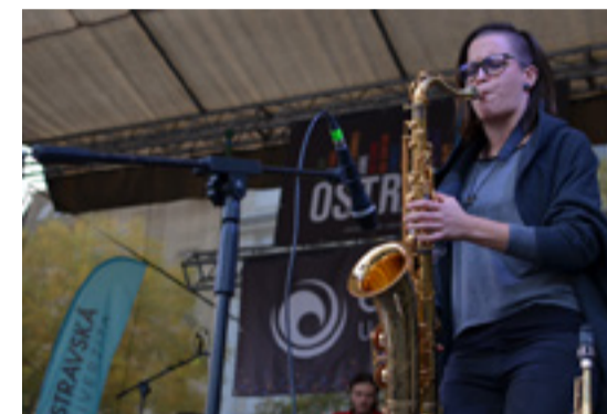
Kapela Marow – energická pecka na konec

V neposlední řadě jsme zde také pokřtili IQač – oficiální pivo studentů Ostravské univerzity, o kterém se dozvíte více v rubrice „Pozvánky“. Ten se dá považovat za jeden z velkých úspěchů tohoto dne: Pivovarský dům musel narychlo dovážet další bečky!