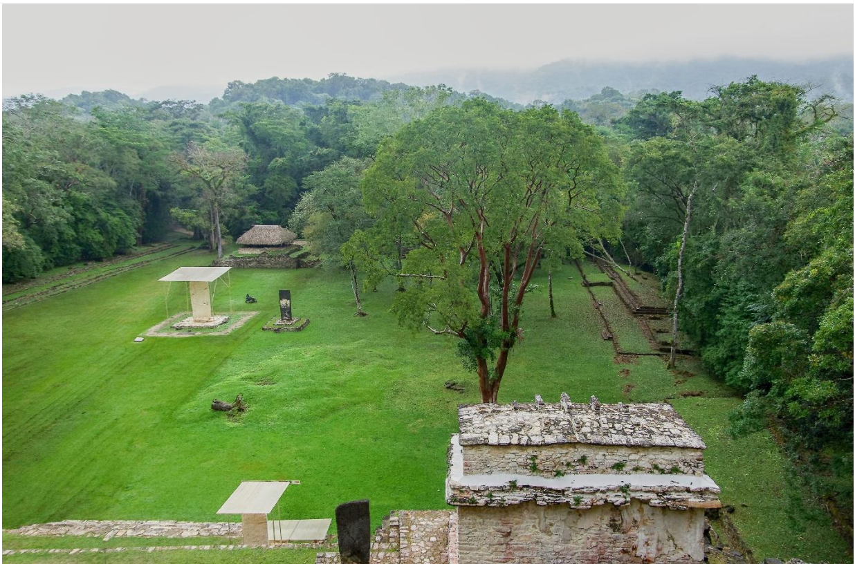
Deštný prales v Bonampak