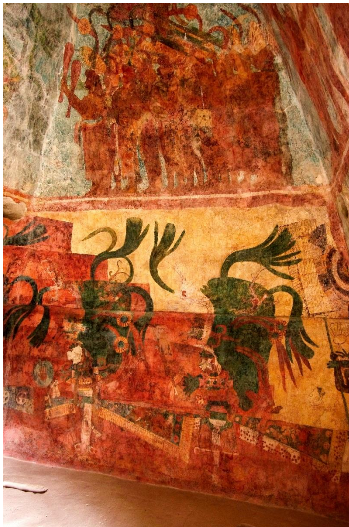
Fresky v Bonampaku