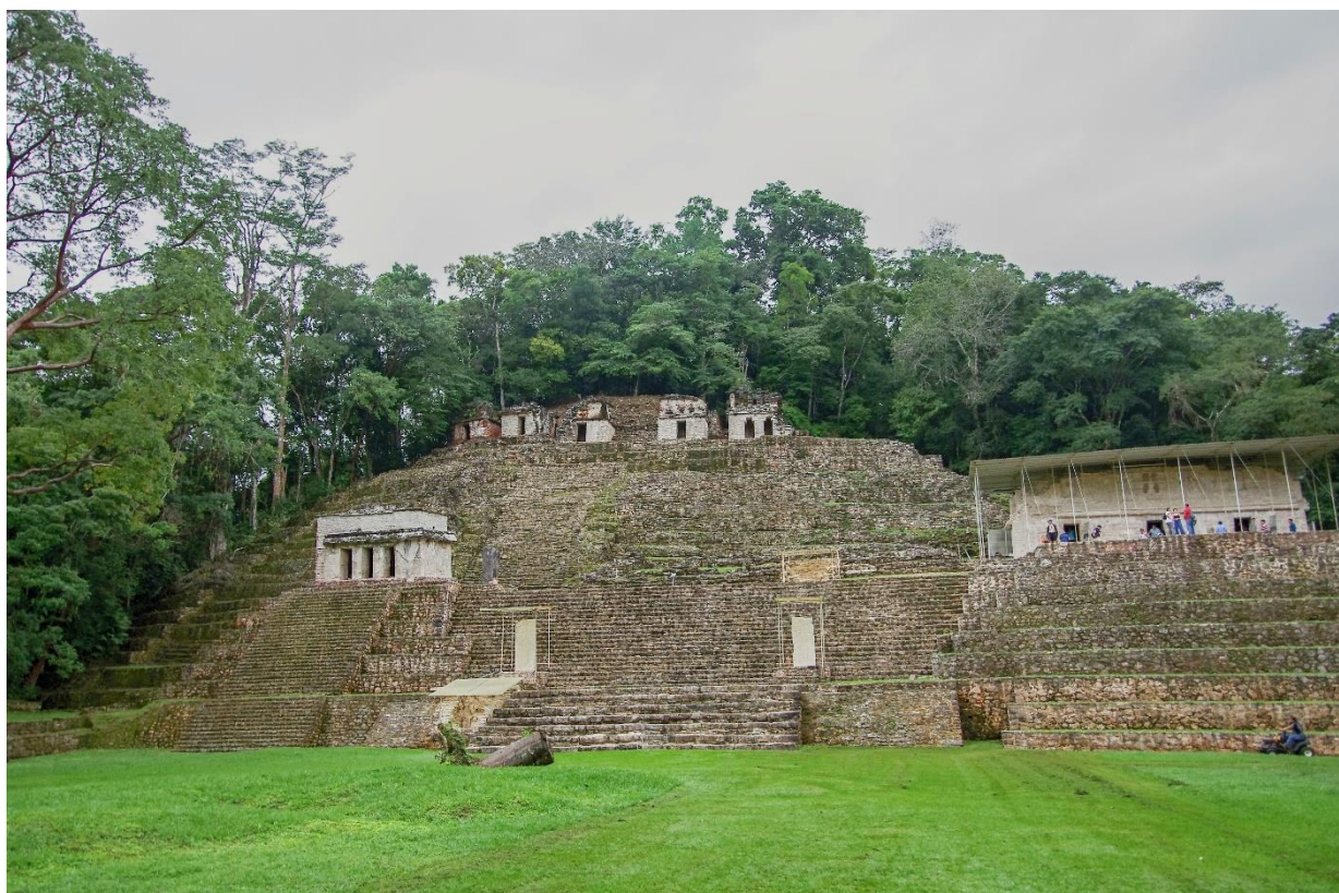
Bonampak – pyramida postavená v úbočí kopce s nejlépe zachovanými mayskými freskami

http://apps.who.int/iris/bitstream/handle/10665/274315/WER9336.pdf?ua=1