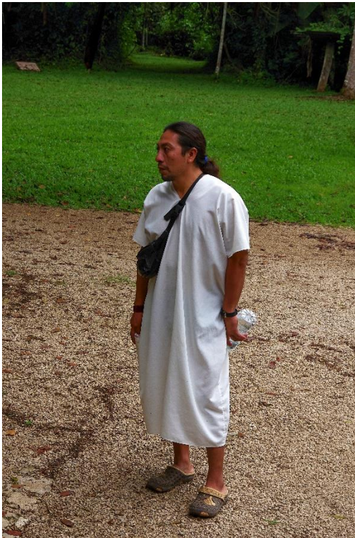
Náčelník kmene Lakandonců (mayský kmen obývající Bonampak) v tradičním oděvu