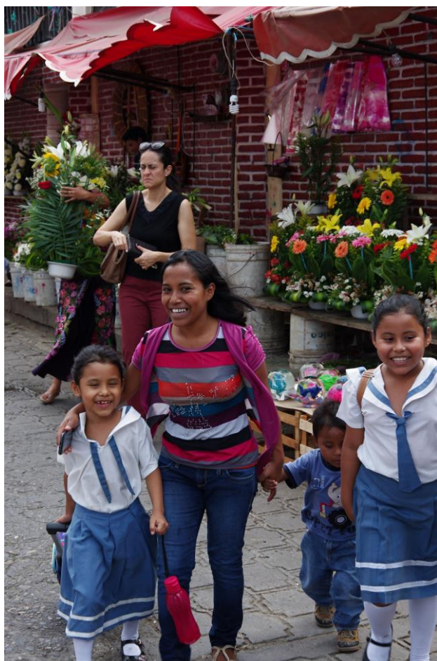
Ženy v San Cristóbal de las Casas