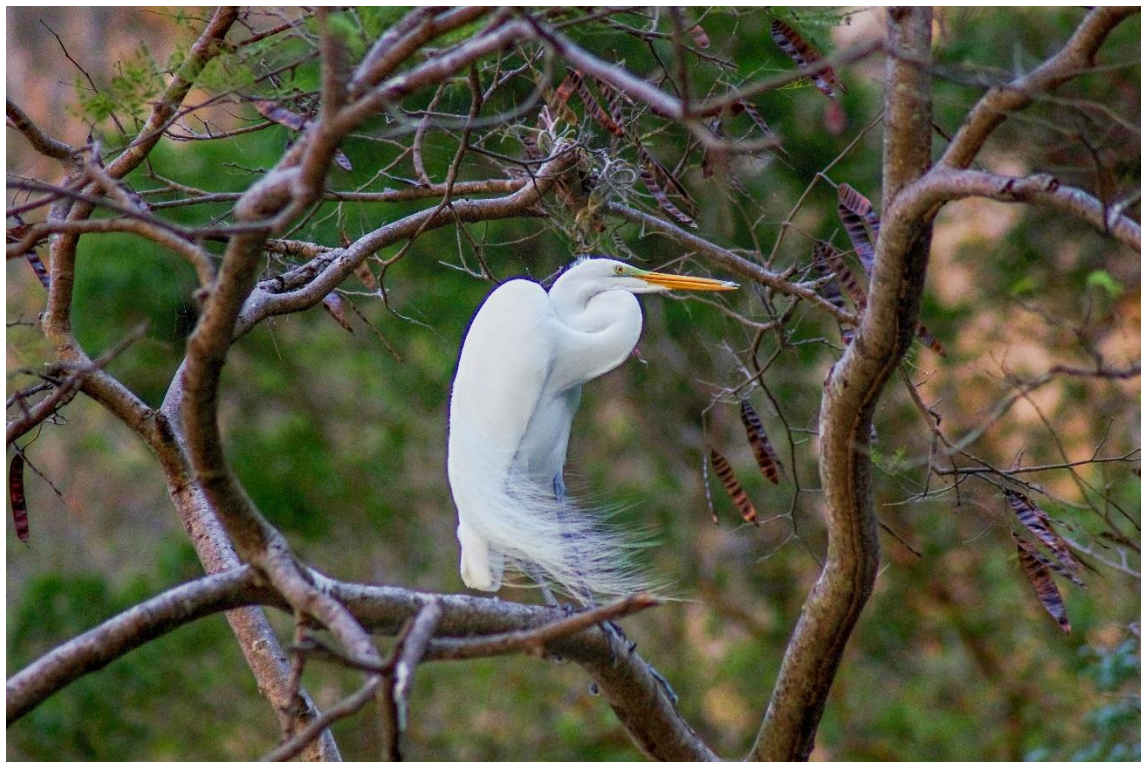
Mexiko: kaňon Sumidero - volavka