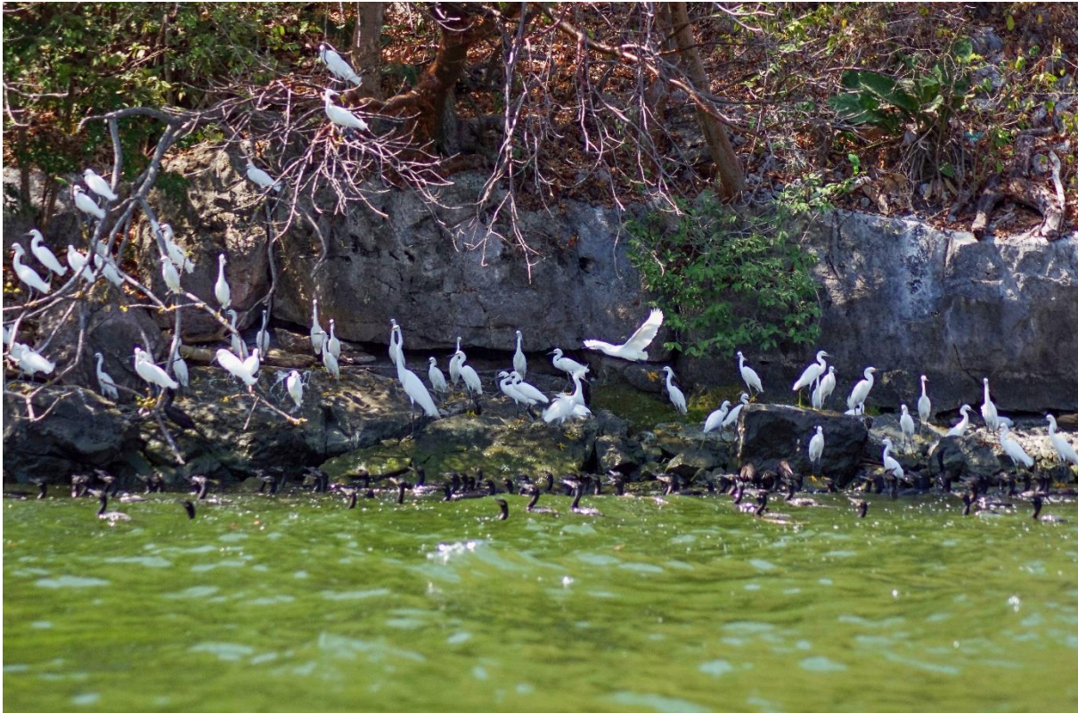
Mexiko: kaňon Sumidero – kolonie volavek a kormoránů