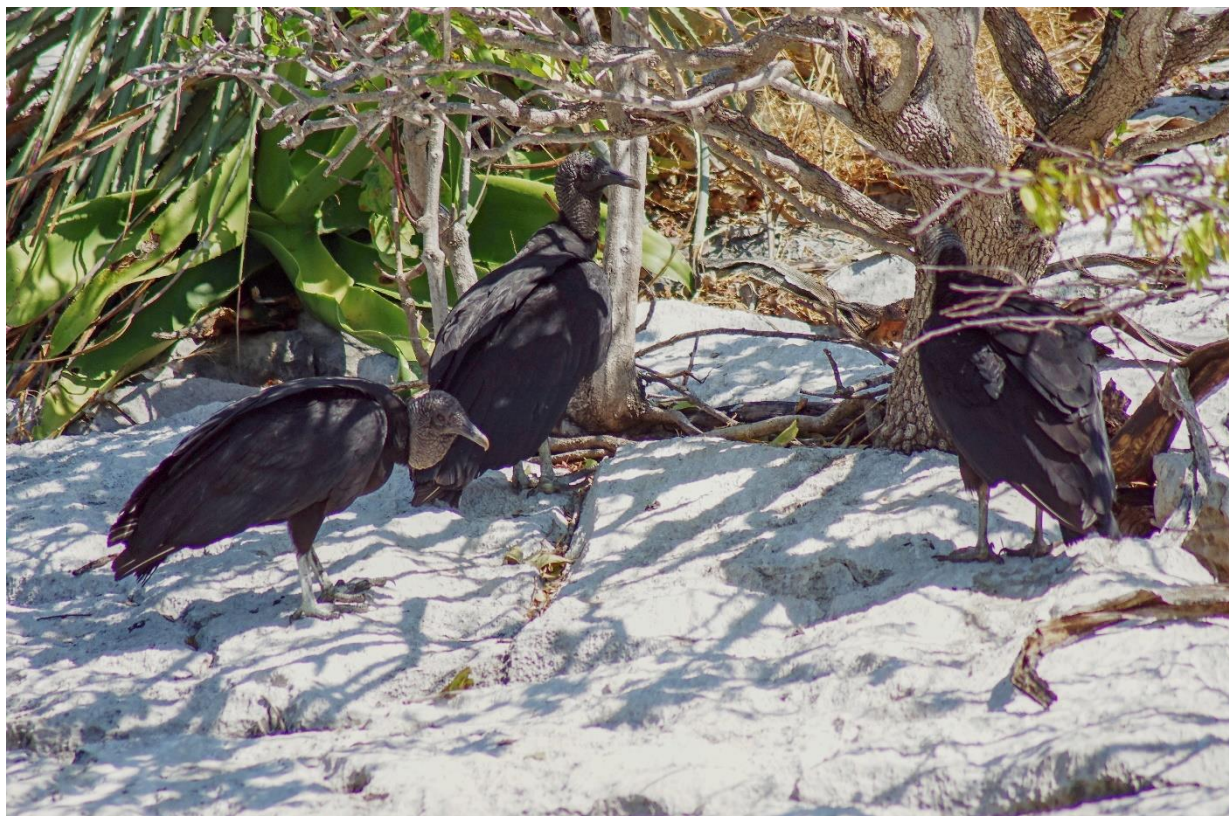
Mexiko: kaňon Sumidero – skupina supů