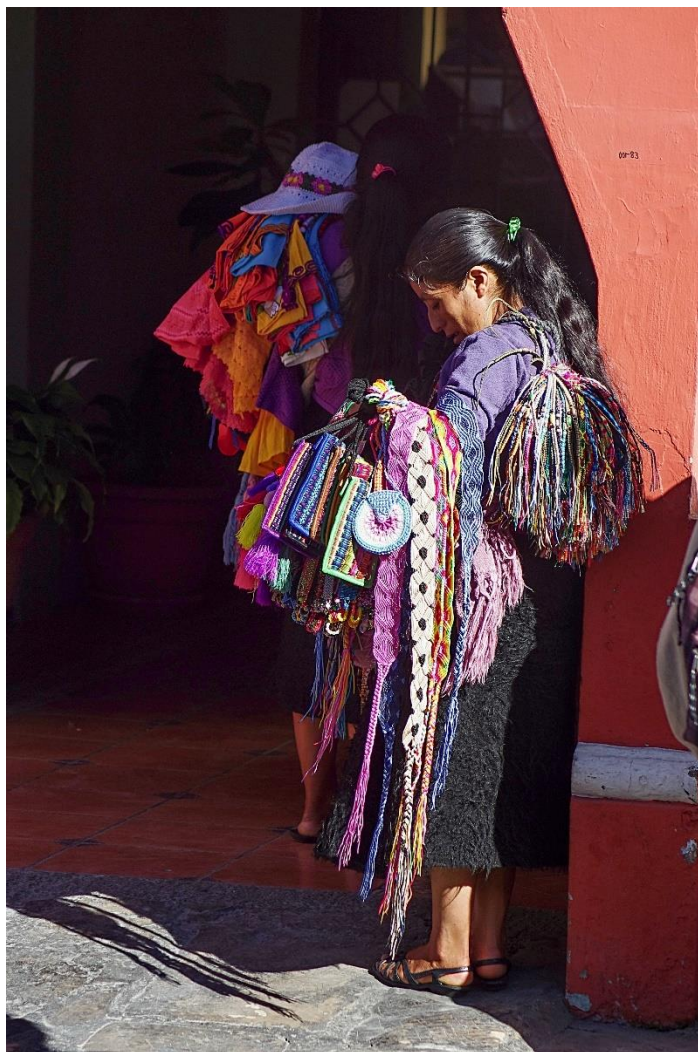
Mexiko: Oaxaca – prodavačka suvenýrů