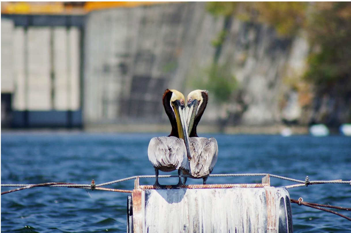
Mexiko: kaňon Sumidero - pelikáni