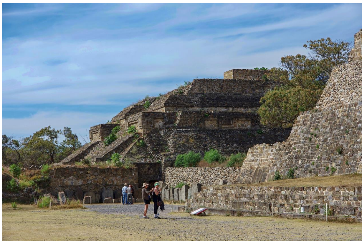
Mexiko: Monte Albán – zapotécko-mixtécké památky