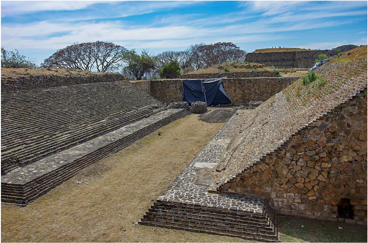
Mexiko: Monte Albán –hřiště na míčovou hru a kostel Sv. Dominika v Oaxace (dole)