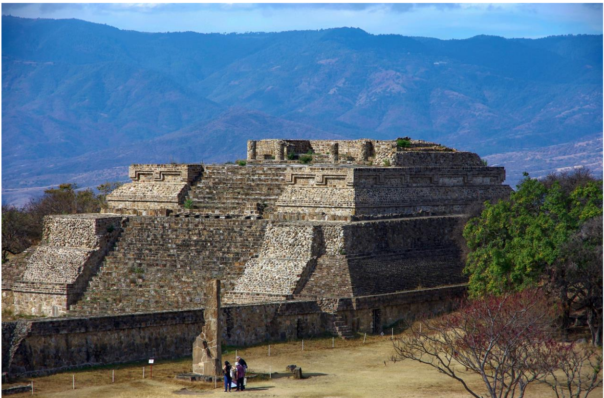
Mexiko: Monte Albán – zapotécko-mixtécké památky