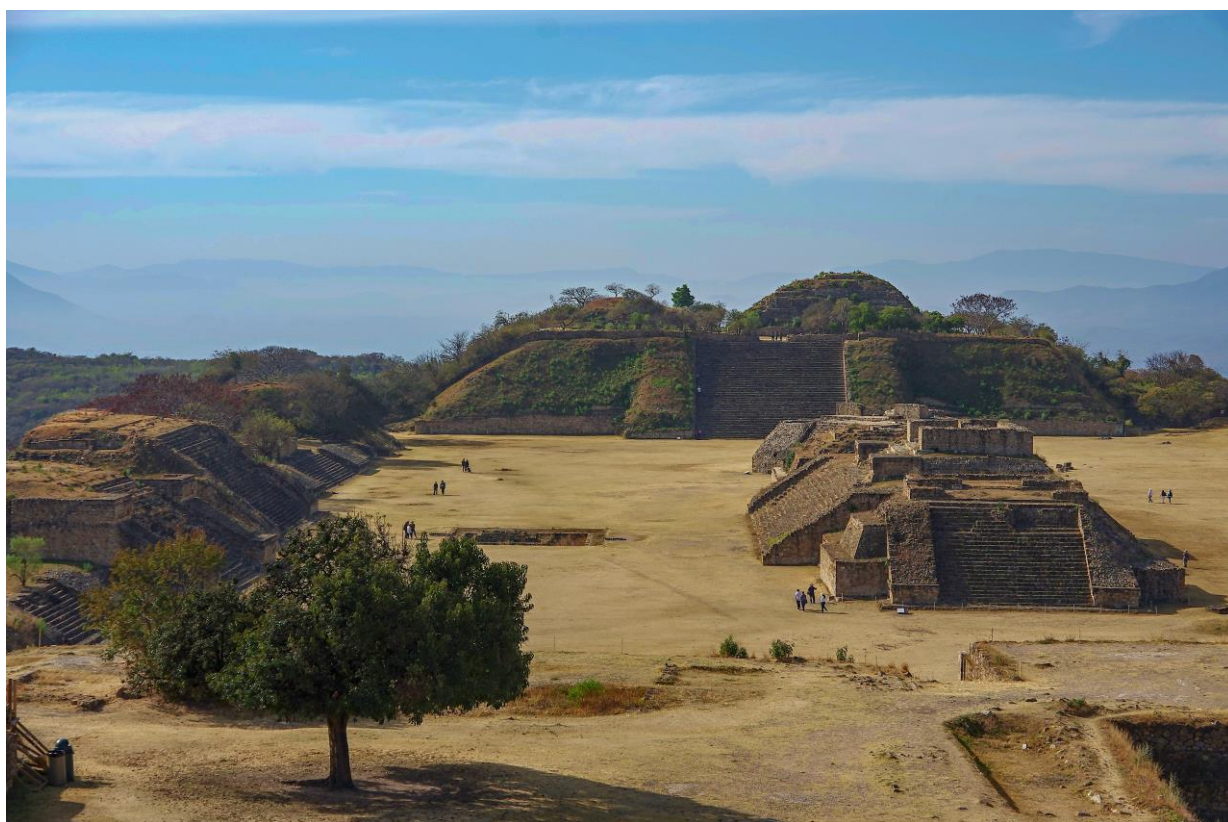
Mexiko: Monte Albán – zapotécko-mixtécké památky

15.9.2018: klíšťová meningoencefalitida: Švýcarsko