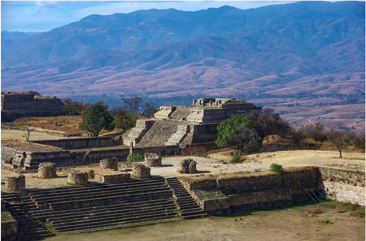
Mexiko: Monte Albán – Zapoteco-mixtecké památky