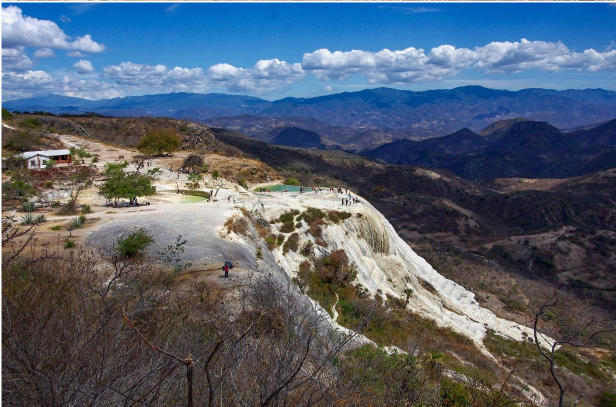
Travertinové kaskády Hierve El Agua