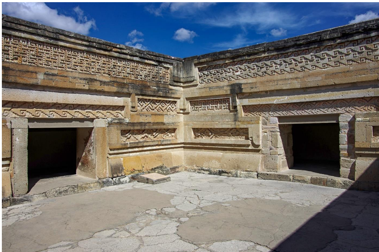
Mitla – vnitřní nádvoří paláce