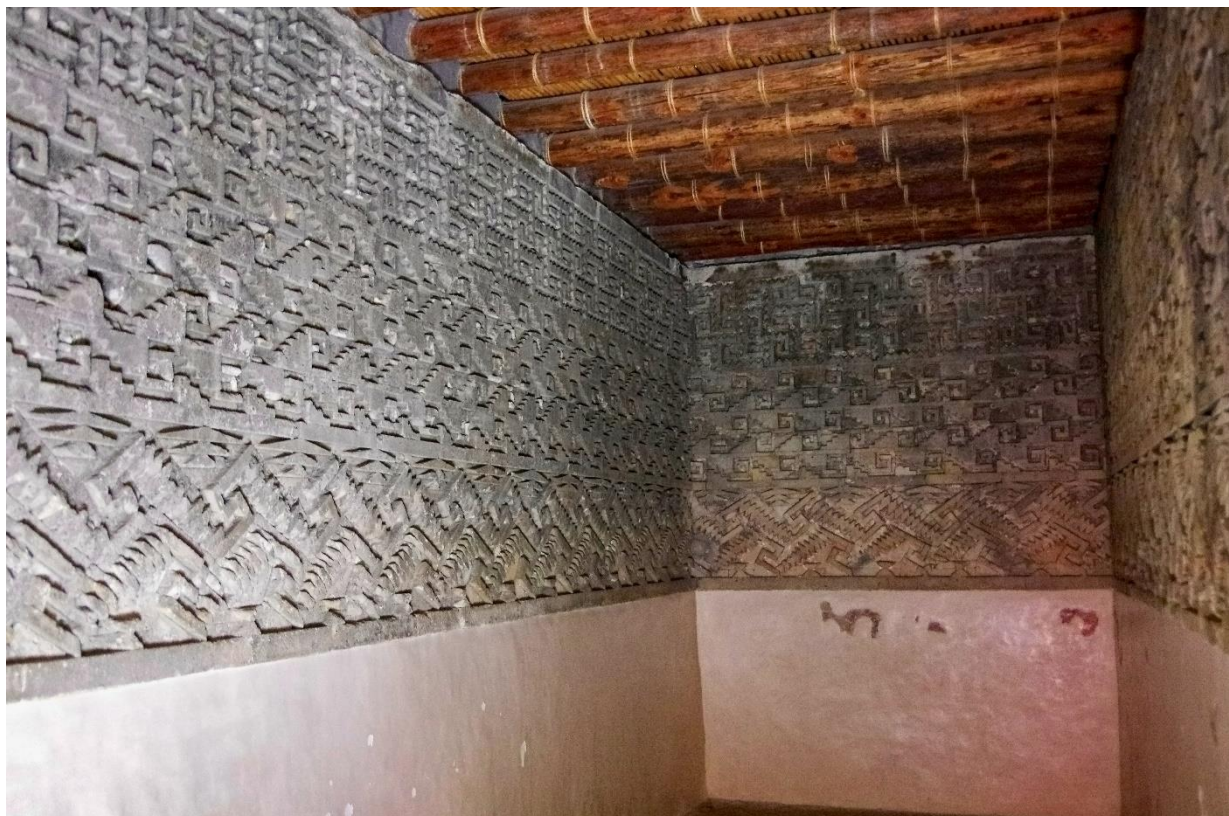
Mitla – vnitřní výzdoba paláce