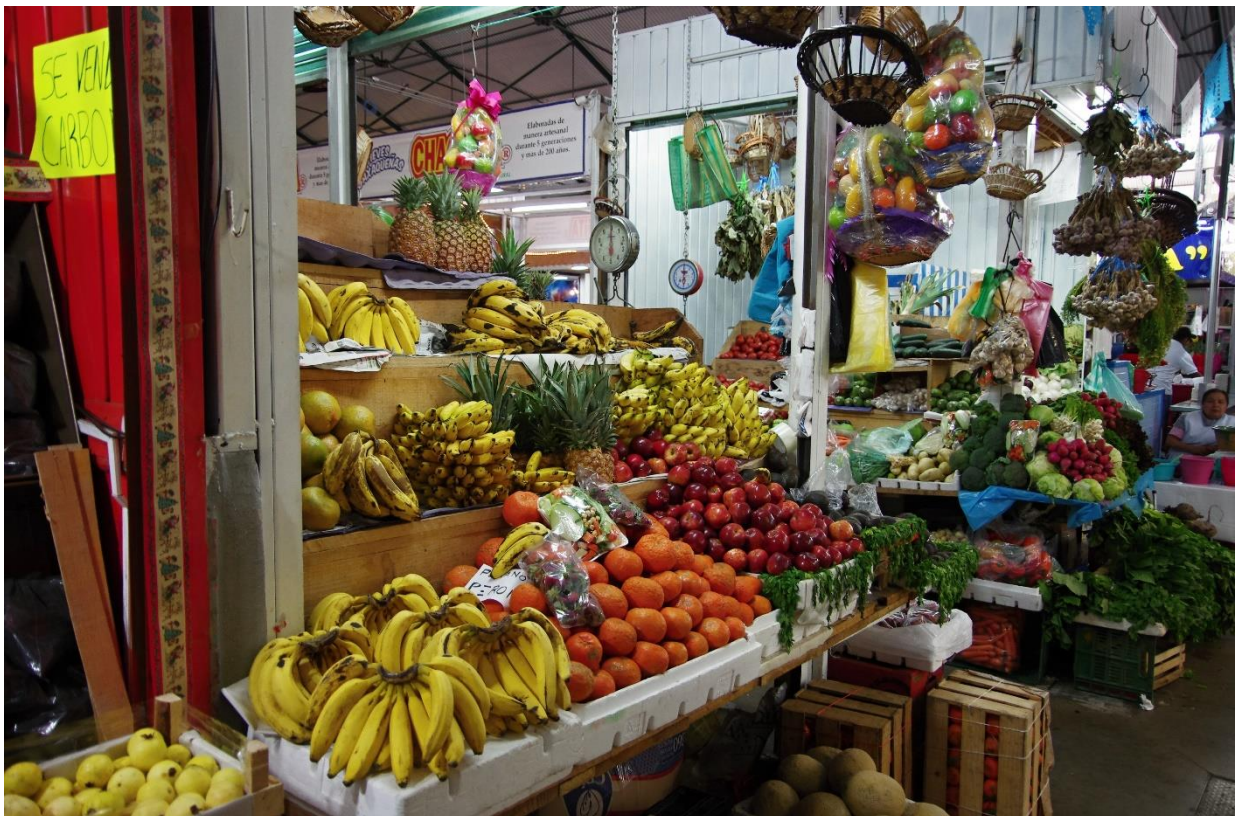
Tržnice v Oaxace