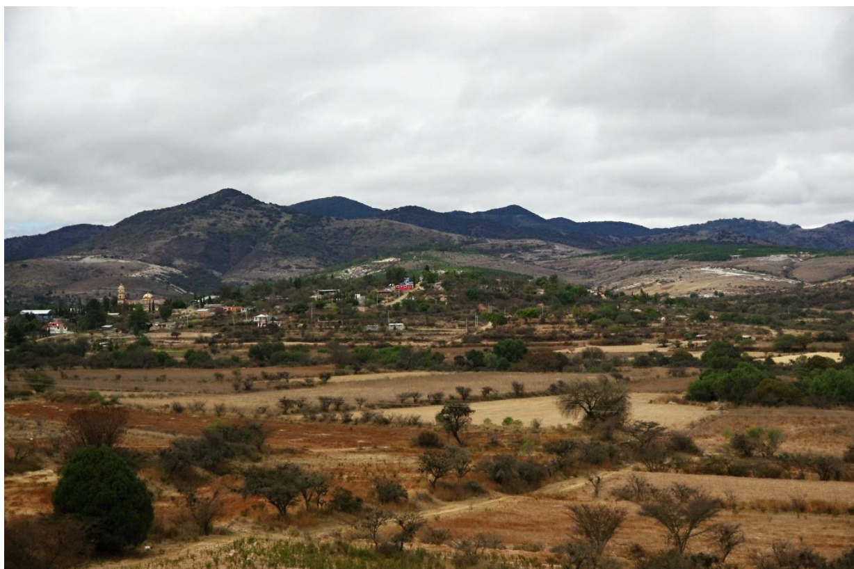
Z Puebla do Oaxaky