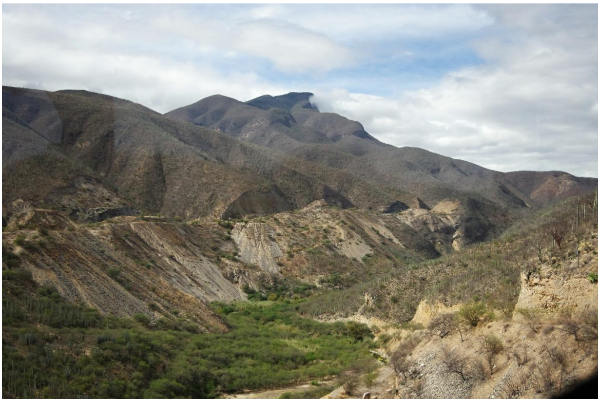
Z Puebla do Oaxaky