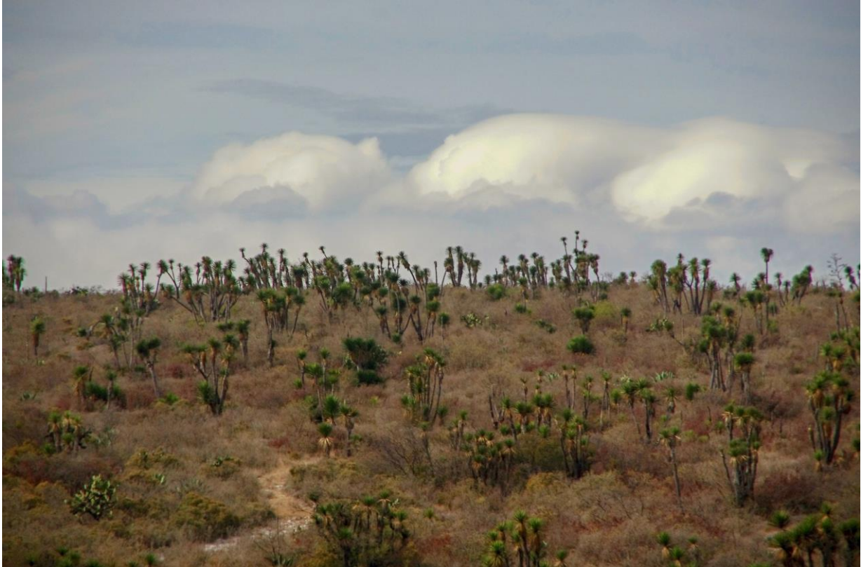
Z Puebla do Oaxaky