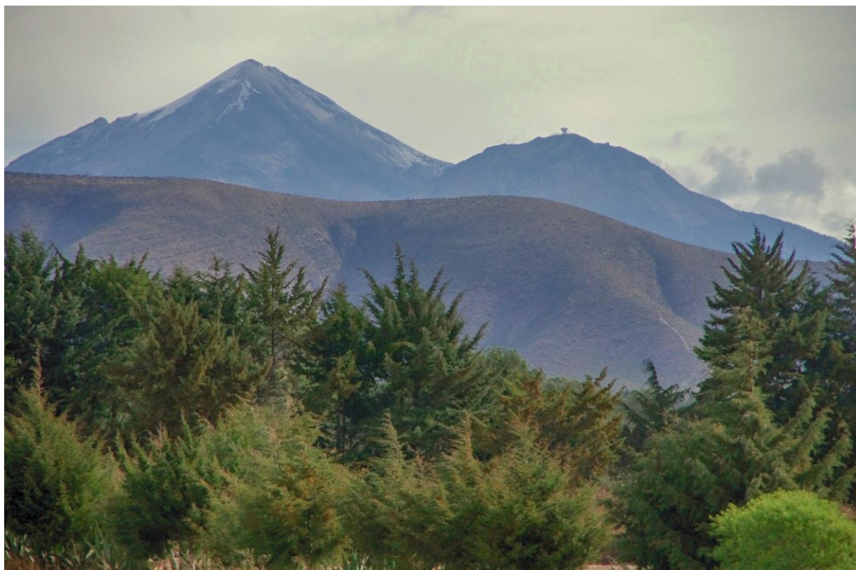
Z Puebla do Oaxaky – sopka Orizaba

ZIKA VIRUS: Amerika, Evropa, Afrika, Asie – výskyt, výzkum, pozorování