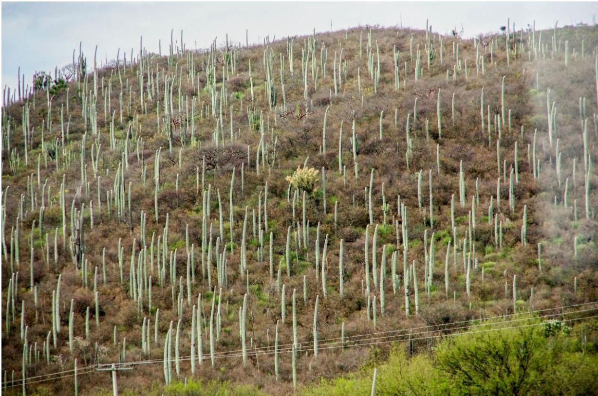
Z Puebla do Oaxaky