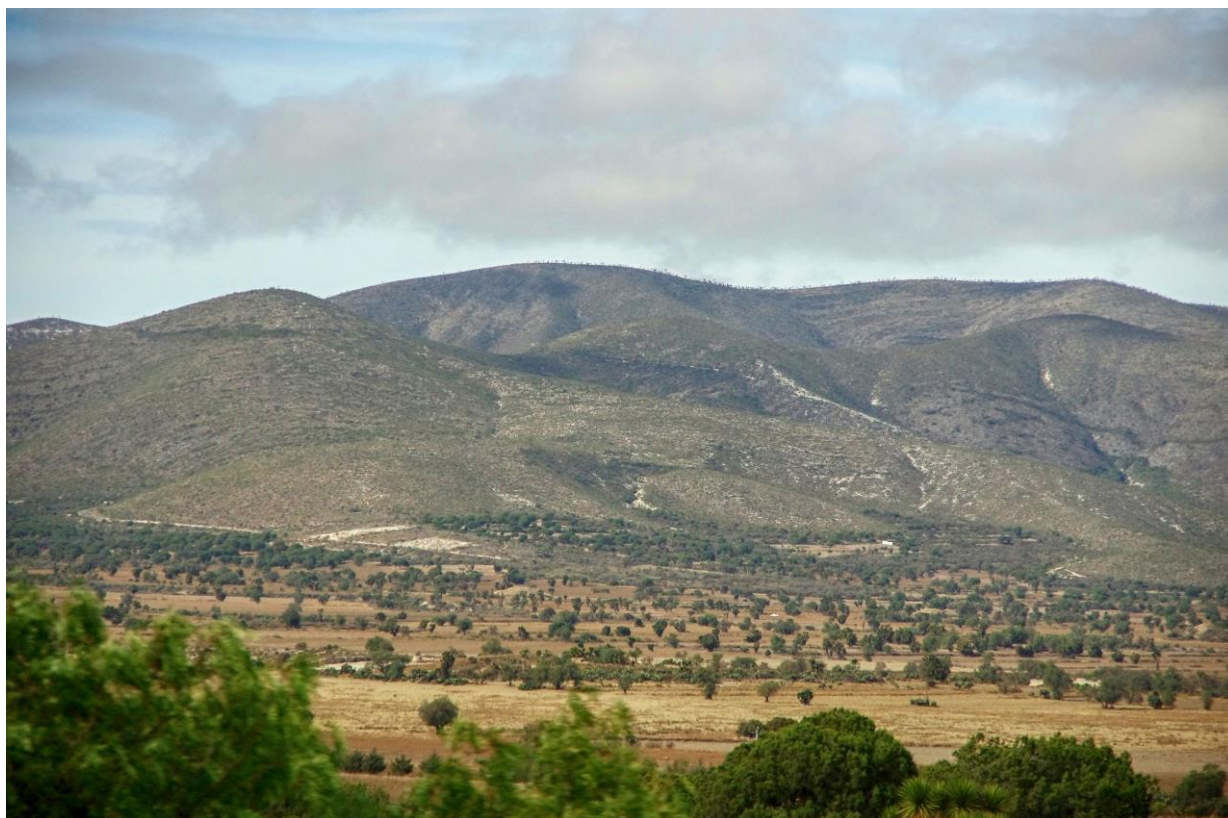
Z Puebla do Oaxaky