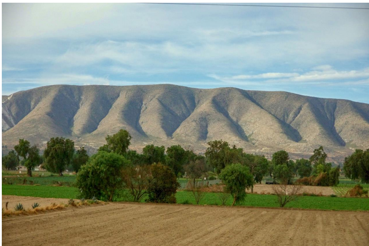
Z Puebla do Oaxaky