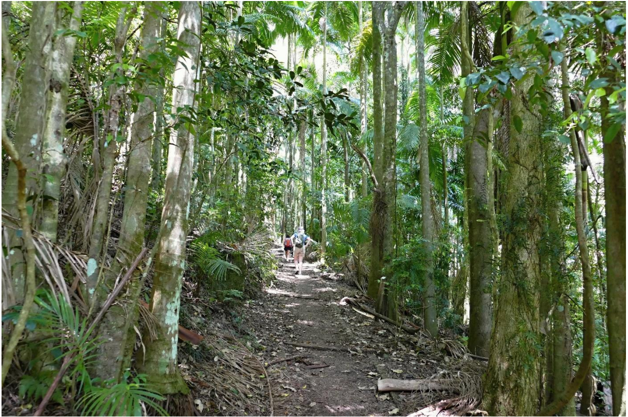
Gondwánské pralesy na Mt. Warning