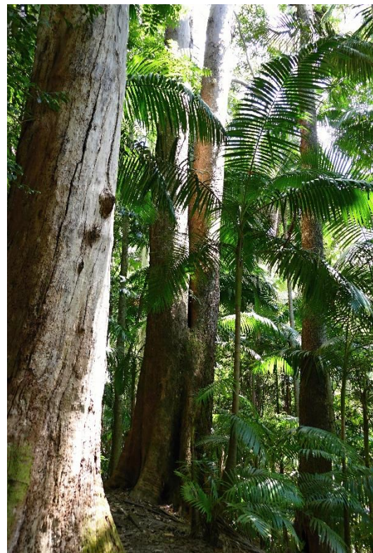
Gondwánské pralesy na Mt. Warning