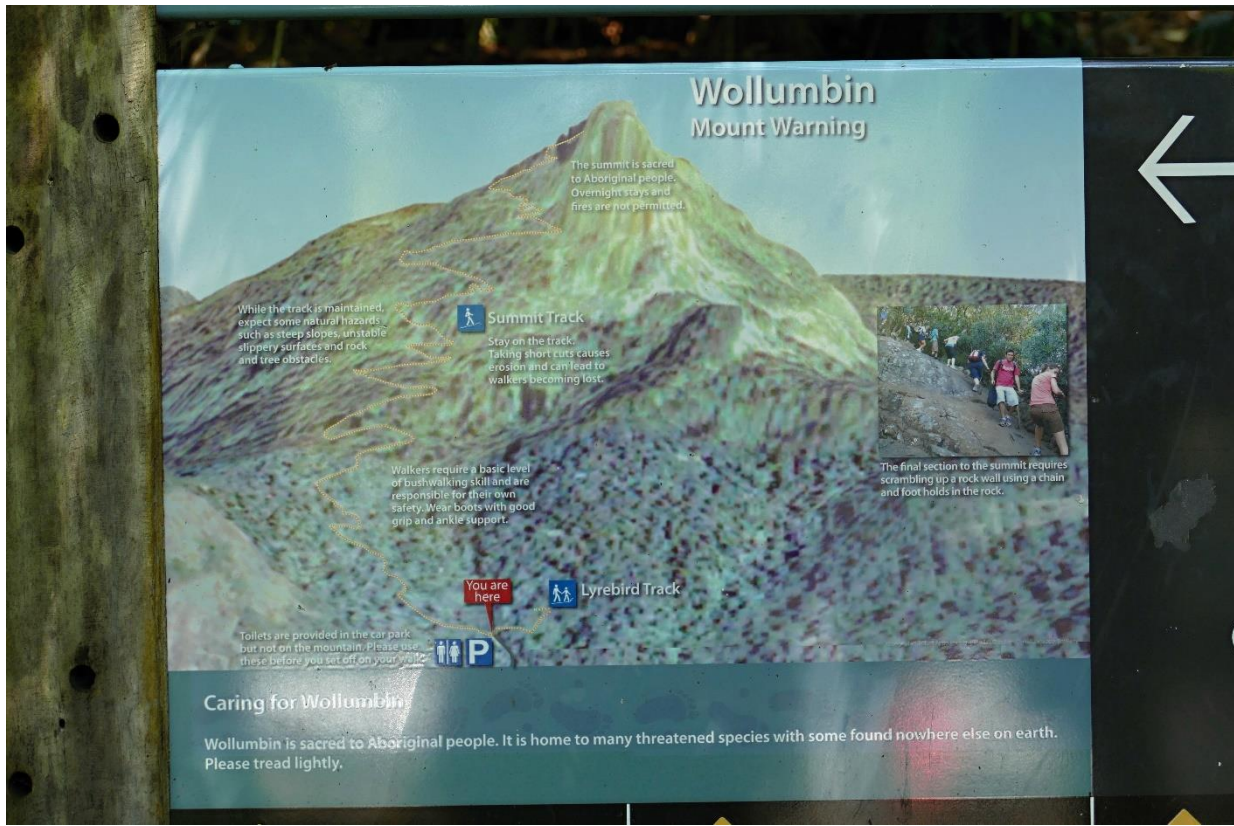
Mt. Warning – náš cíl