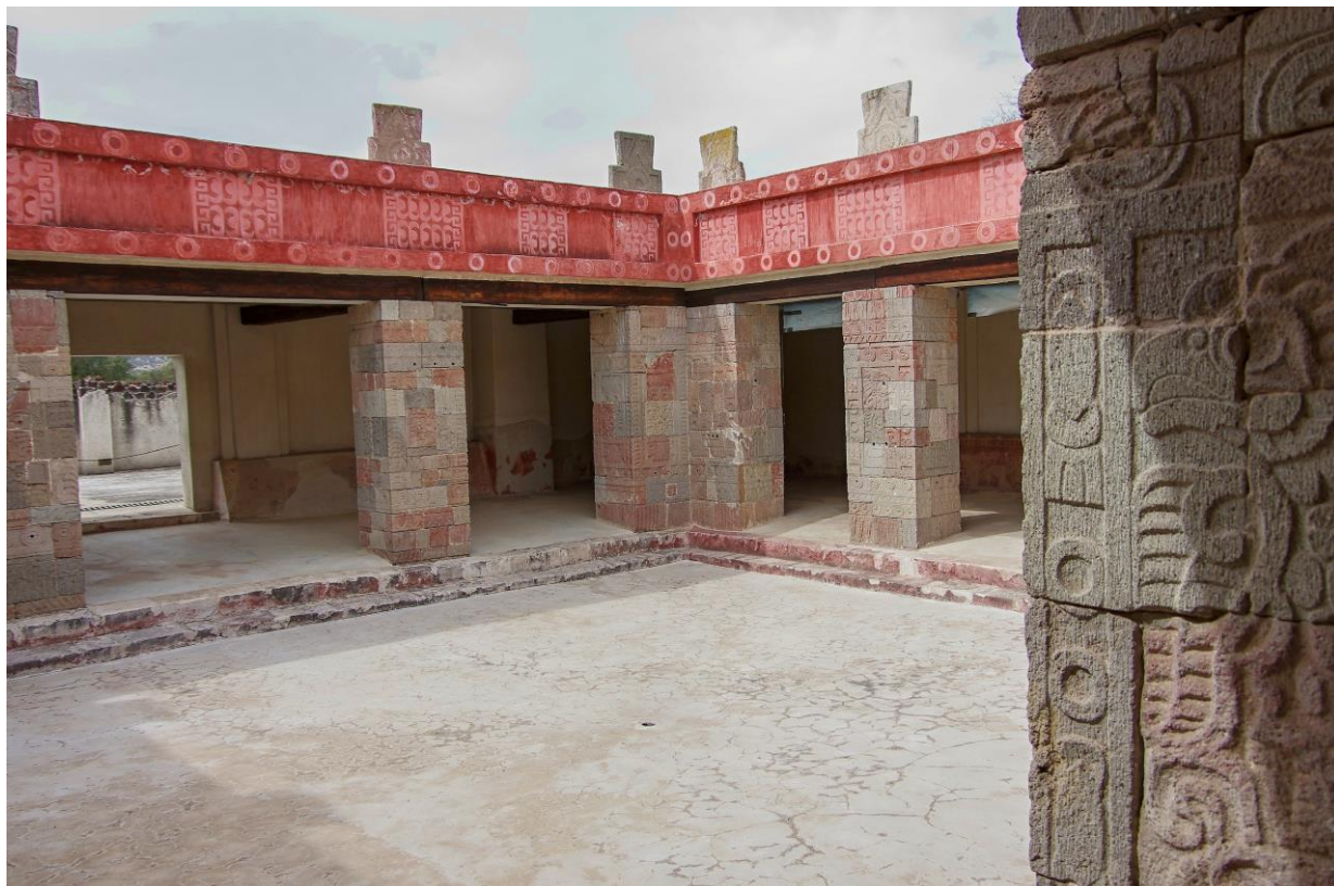
Teotihuacán - Palác Quetzalpapálotla