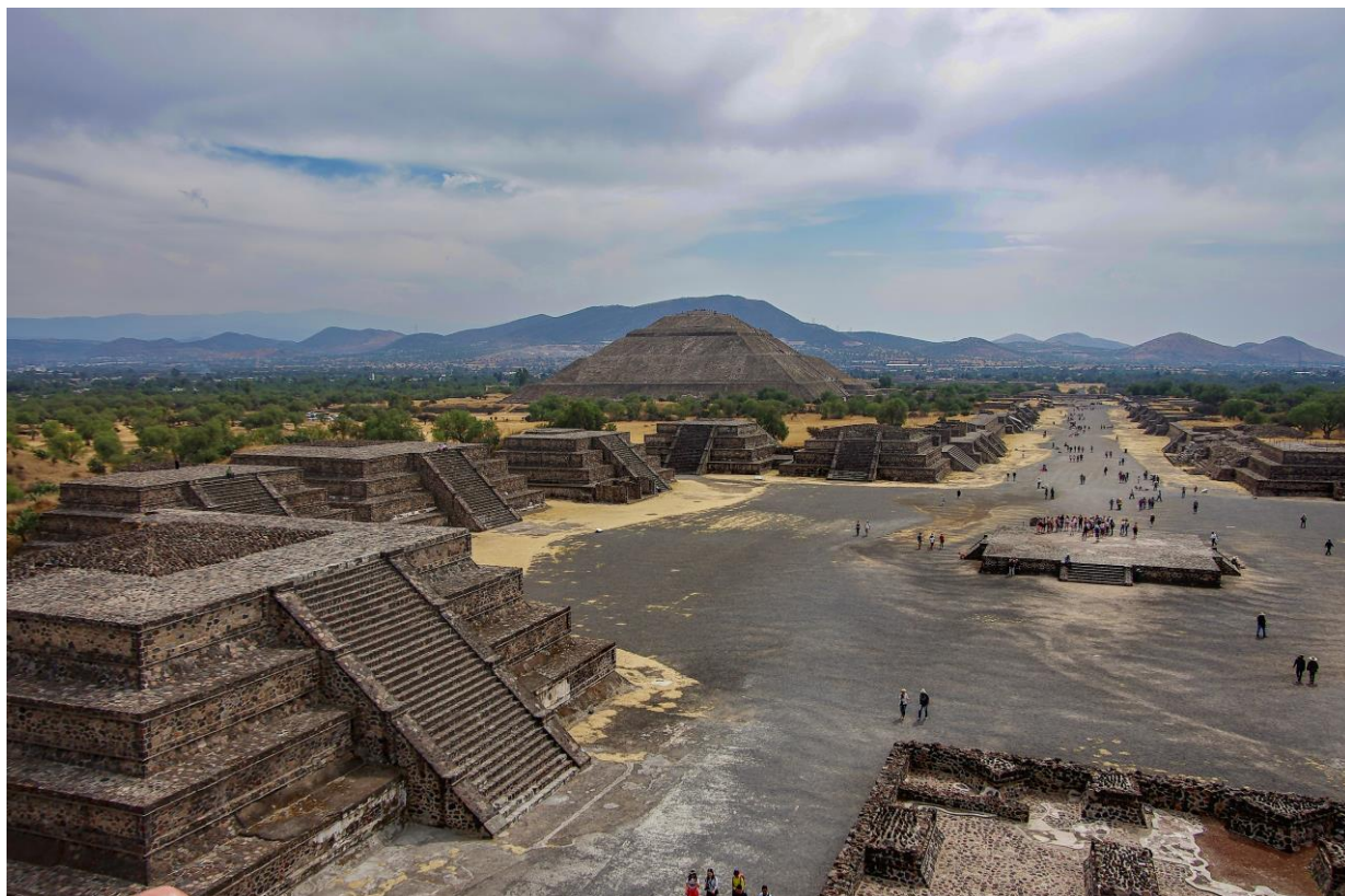
Teotihuacán – pohled z Pyramidy Měsíce na Cestu mrtvých a Pyramidu Slunce