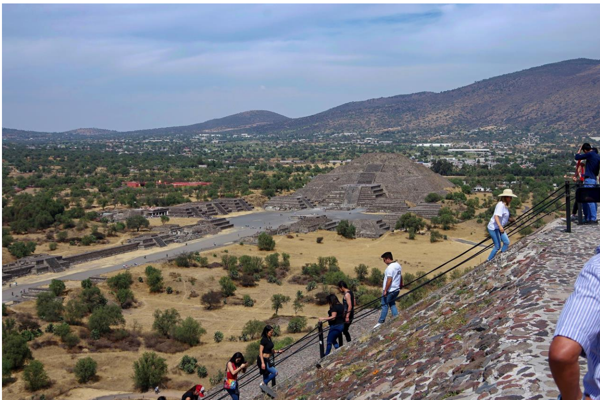
Teotihuacán – pohled z Pyramidy Slunce na Cestu mrtvých a Pyramidu Měsíce