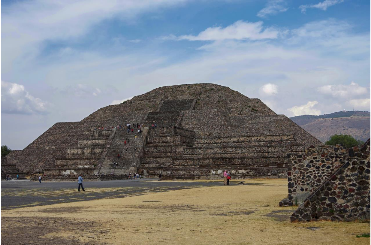
Teotihuacán – Pyramida Měsíce