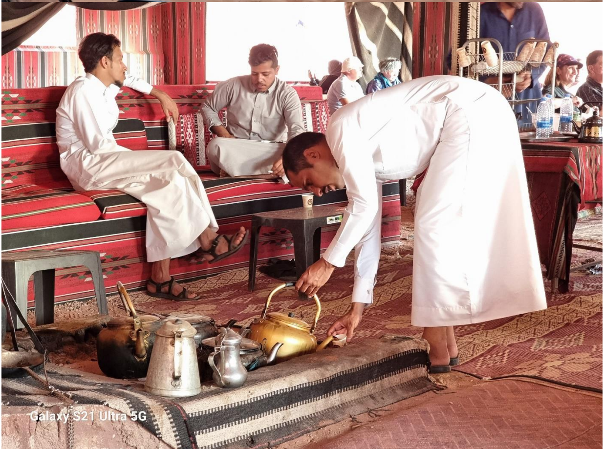
Galaxy S21 Ultra 5G