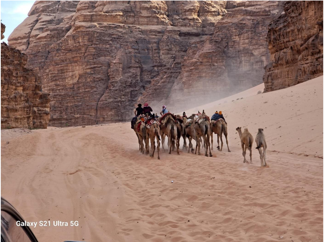
Galaxy S21 Ultra 5G