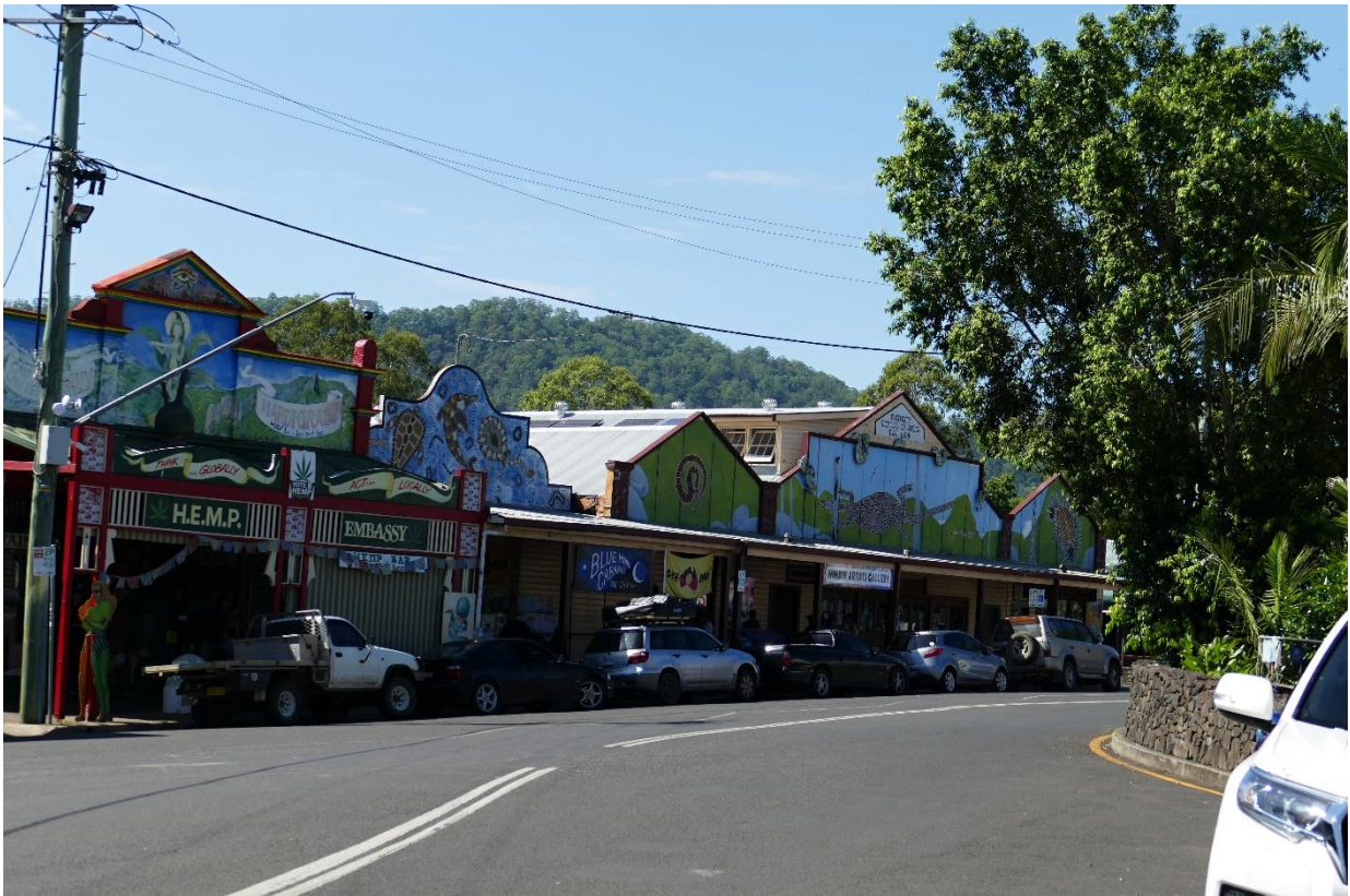
Austrálie: Nimbin městečko hippies