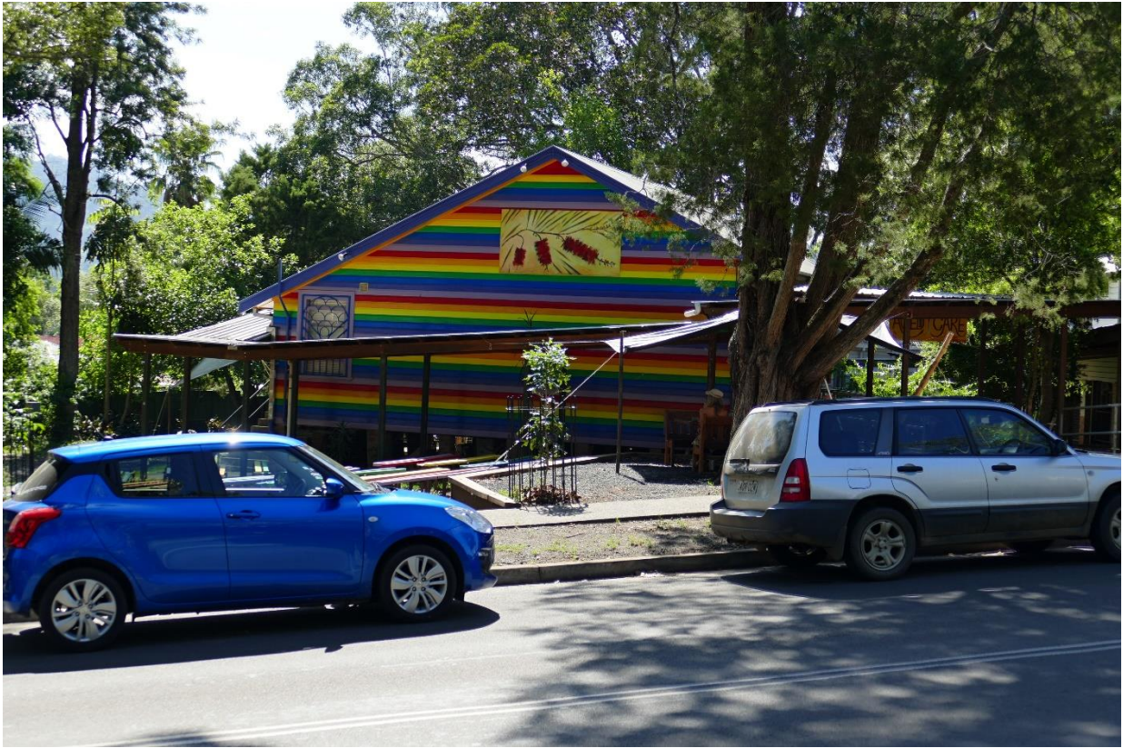
Austrálie: Nimbin městečko hippies