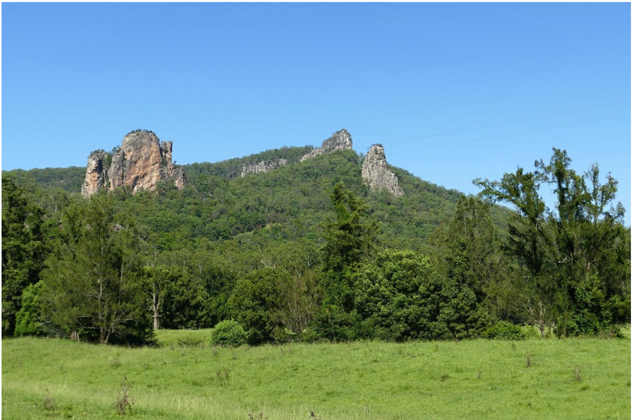
Austrálie: ráz krajiny v oblasti Gold Coast