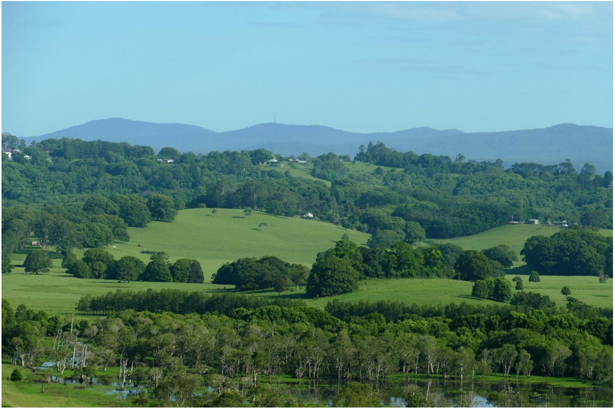
Austrálie: ráz krajiny v oblasti Gold Coast