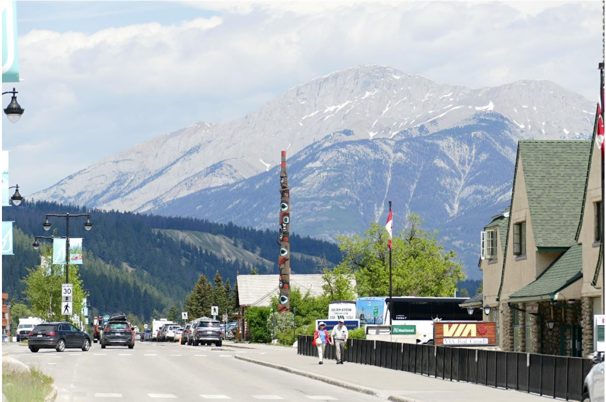
Kanada: město Jasper