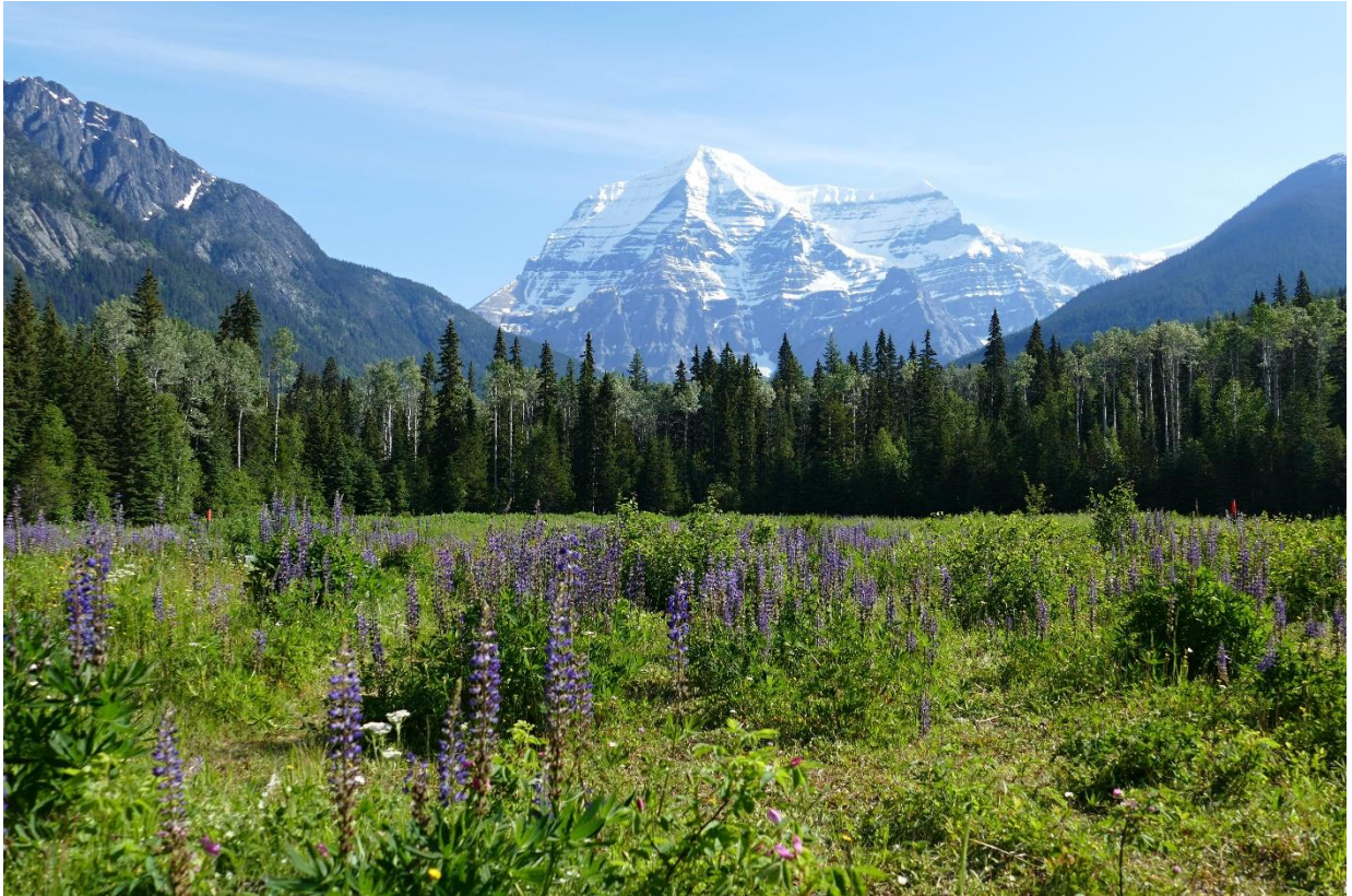
Kanada: údolí Fraser River