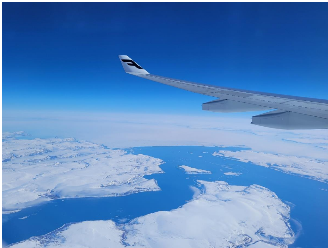
Ostrovky mezi Gronskem a Severní Amerikou