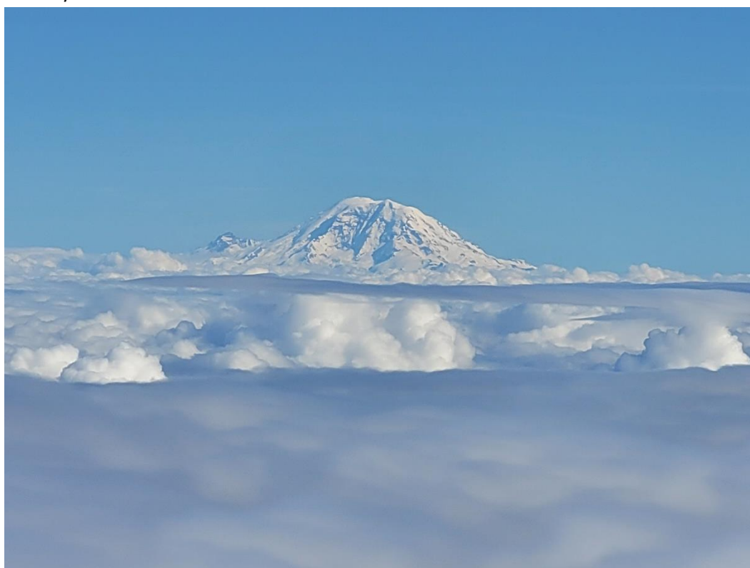
Stratovulkán Mt. Rainier (4 392 m), USA stát Washington