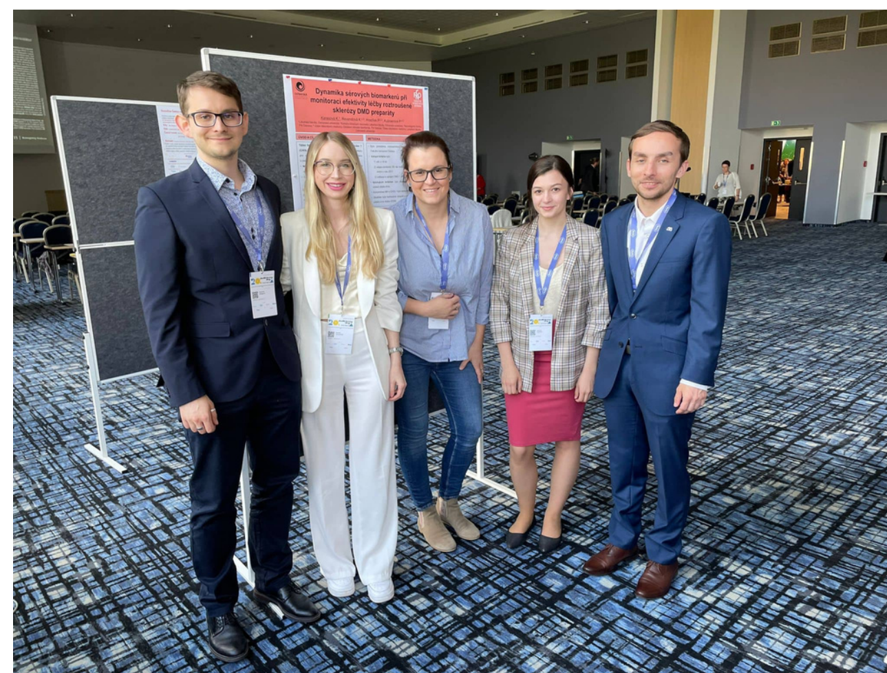
Jedličkovy dny 2022