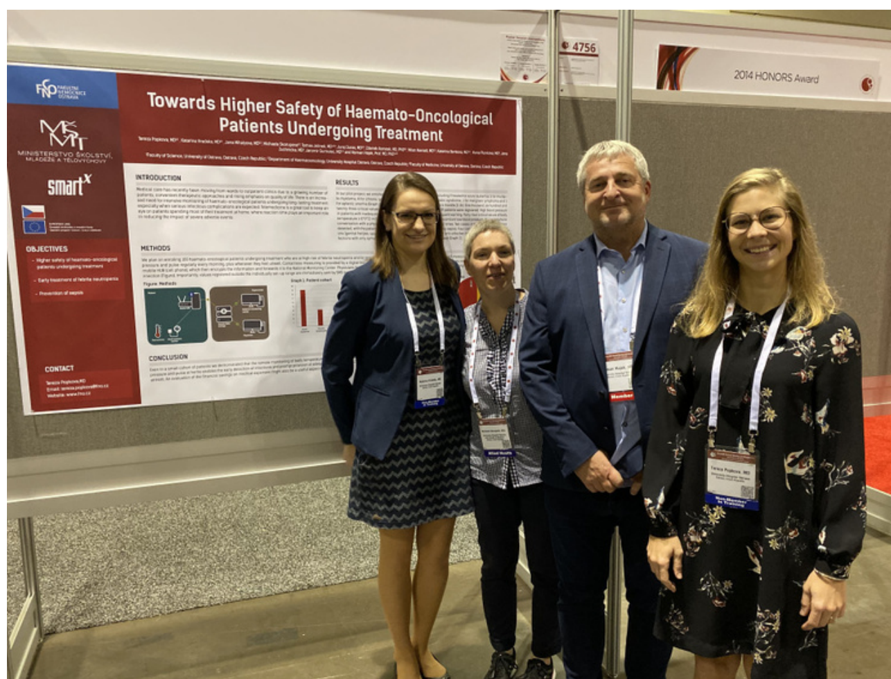
Poster ASH 2020

Lékaři naší kliniky se věnují řadě vědeckých, výzkumných a publikačních aktivit, za které byli oceněni na národní i nadnárodní úrovni.