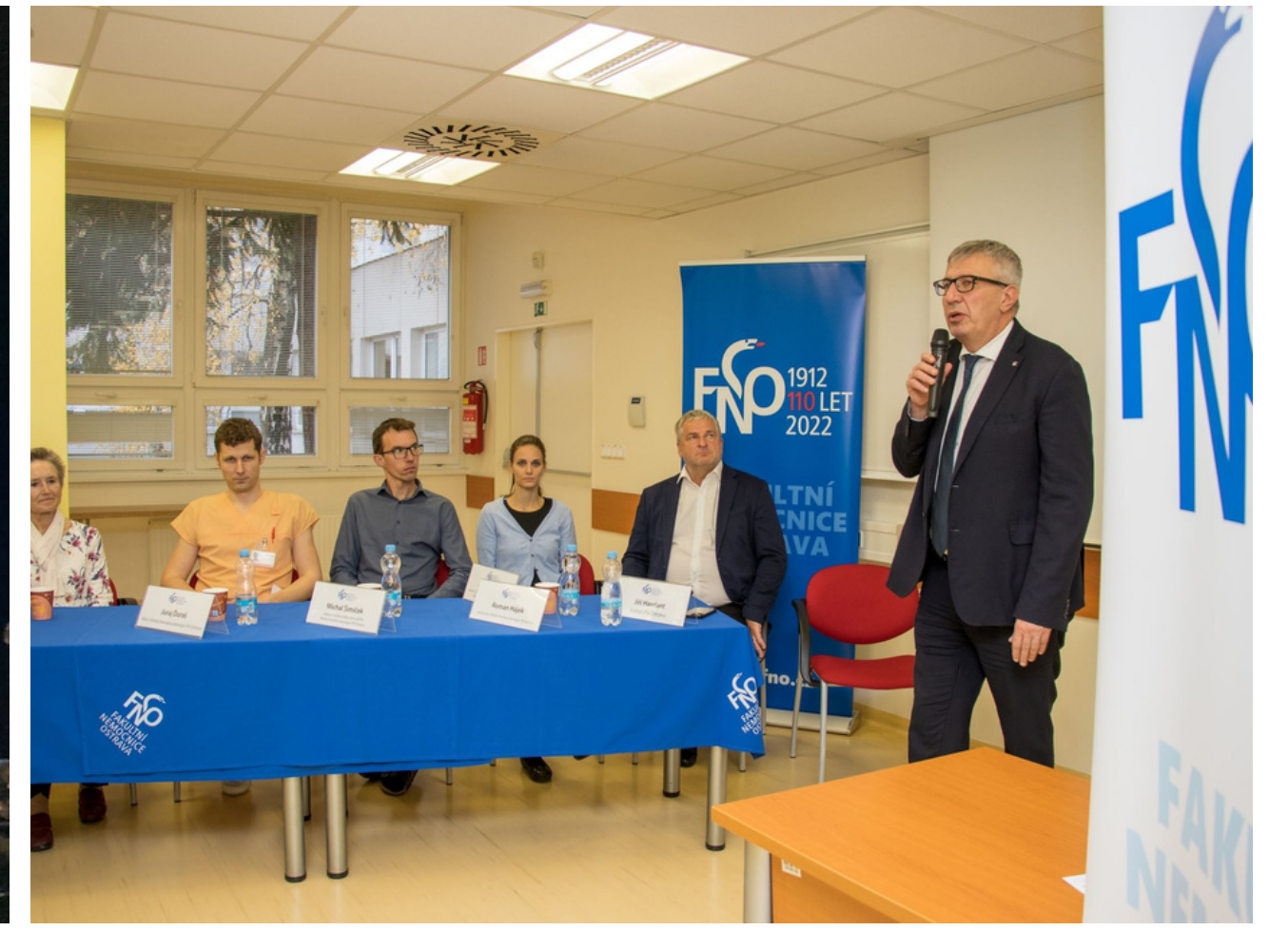
První pacientka po CAR-T léčbě

Lékaři pracují v rámci specializovaných týmů zaměřených na jednotlivé diagnózy: