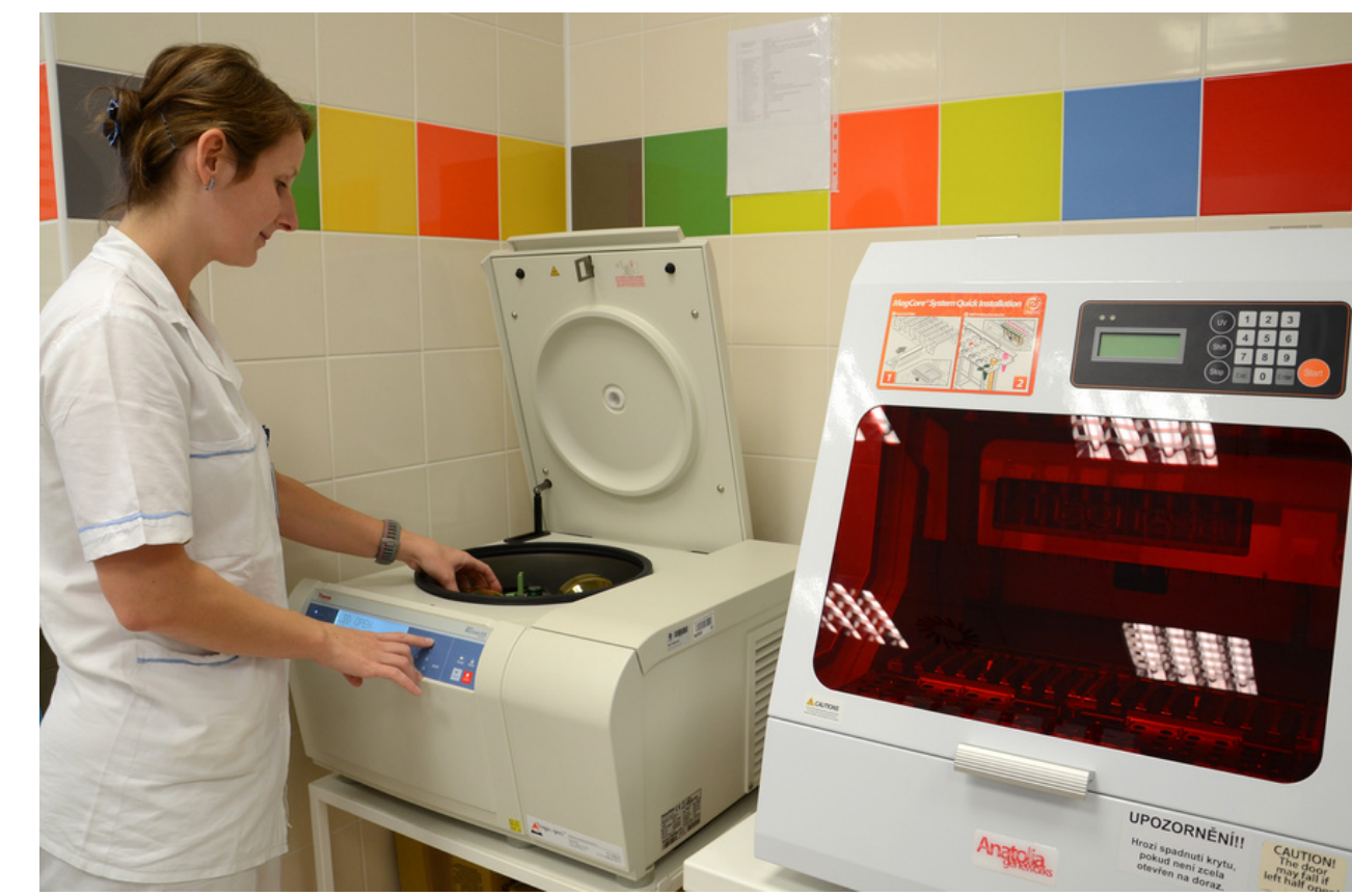
21.6.2013 V ostravské fakultní nemocnici otevřeli první biobanku v kraji

Biobanka slouží k dlouhodobému uskladňování vzorků biologického materiálu pacientů, například krve, plazmy, séra, slin a dalších. Je společným projektem Fakultní nemocnice Ostrava a Lékařské fakulty Ostravské univerzity.