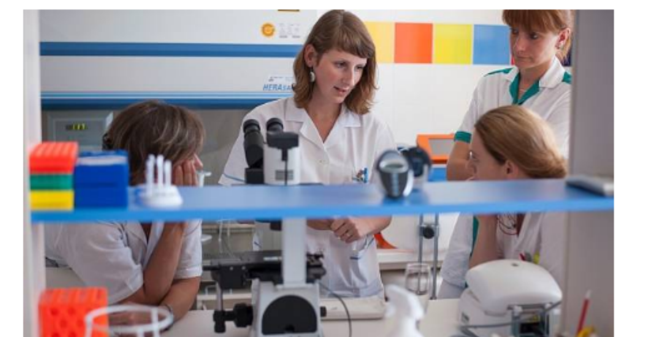
PRVNÍ BIOBANKA. K dlouhodobému uskladňování biologického materiálu pacientů bude sloužit historický první biobanka v Moravskoslezském kraji.

Biobanka slouží k dlouhodobému uskladňování vzorků biologického materiálu pacientů, například krve, plazmy, séra, slin a dalších. Je společným projektem Fakultní nemocnice Ostrava a Lékařské fakulty Ostravské univerzity.