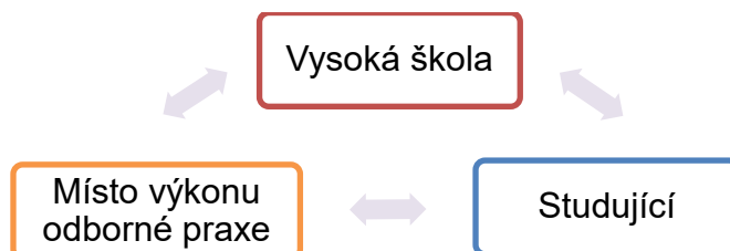
Obrázek č. 1: Schéma subjektů odborného praktického vzdělávání

Procesu odborného praktického vzdělávání se plánovaně, systematicky a koordinovaně účastní tři subjekty . Jsou jimi vysoká škola, místo výkonu odborné praxe a student .