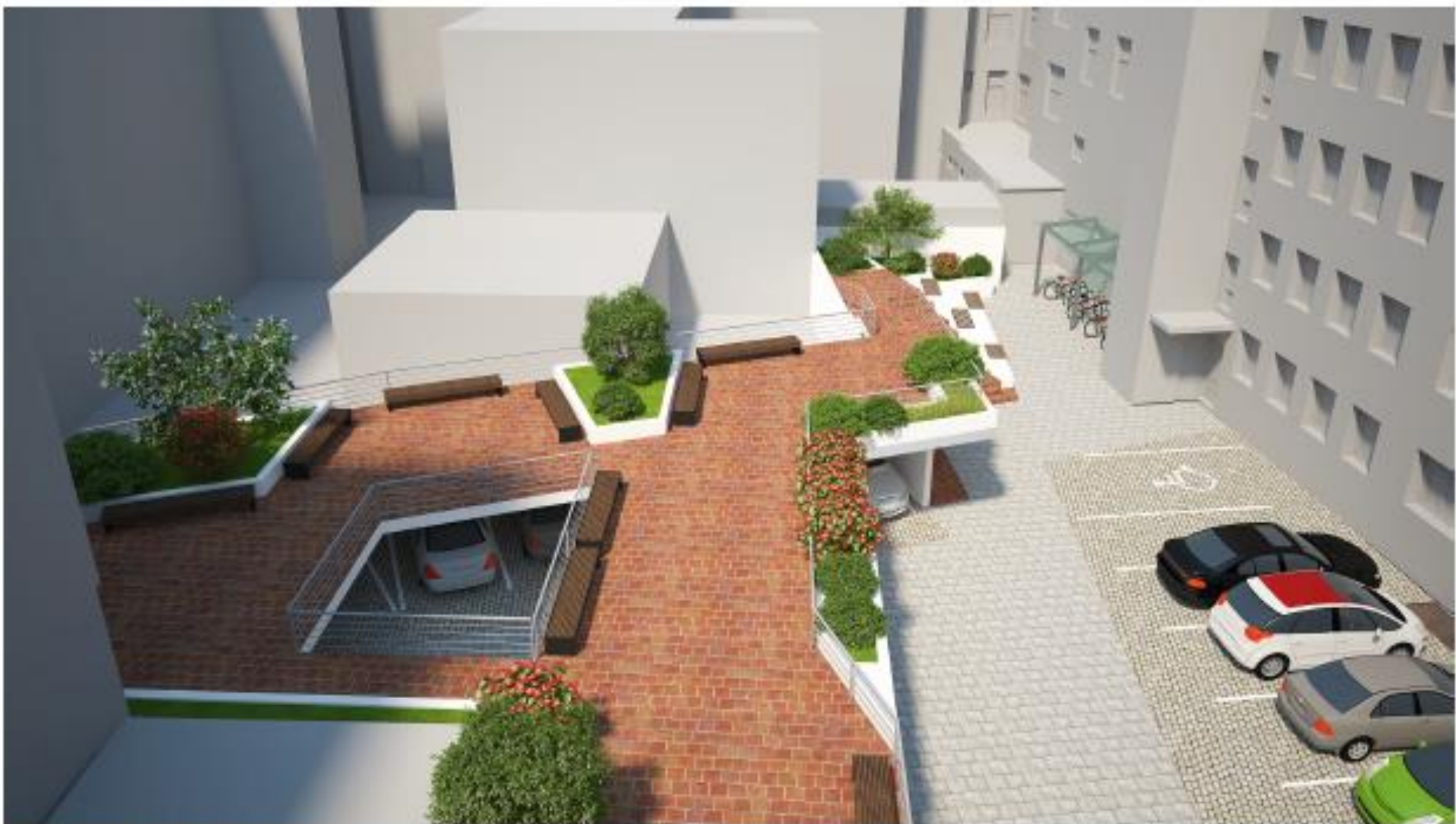
01 - POHLED Z "PAVLAČE" BUDOVY E