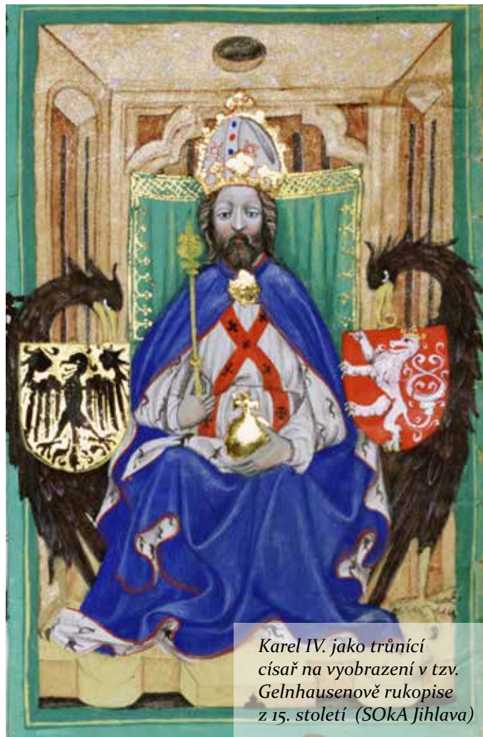
Karel IV. jako trůnící císař na vyobrazení v tzv. Gelnhausenově rukopise z 15. století

Ve svých úvahách o ideální vládě vedoucí ke spravedlivému uspořádání společnosti, které Karel mistrně vkládal do svého životopisného díla za účelem poučení svých nástupců, vycházel z obecně sdílené středověké představy, podle které byl panovník nadán svojí mocí na základě vůle Boha – krále králů. Tento způsob legitimizace moci, který je v dnešních euro-atlantických společenstvích nahrazen institutem většinového souhlasu realizovaného v rámci demokratických voleb, kladl na středověkého pa-