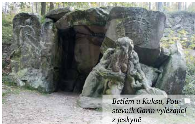
Betlém u Kuksu, Poutevník Garin vylézající z jeskyně

Braun časem onemocněl souchotinami, a tak vlastní těžkou sochařskou práci vykonávali jeho zaměstnanci, zatímco on se soustředil hlavně na tvorbu modelů a návrhů. Díky svým širokým znalostem a dovednostem se Matyáš Bernard Braun stal jedním z nejnámějších a nejuznávanějších sochařů ve střední Evropě.