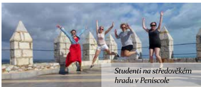
Studenti na středověkém hradu v Peniscole

Naše exkurze začala po několikaměsíční přípravě v sobotu 26. 9. 2015 ve tři hodiny ráno. V tu dobu jsme se všichni usadili v autobuse a vyrazili. Cílem byla Barcelona.