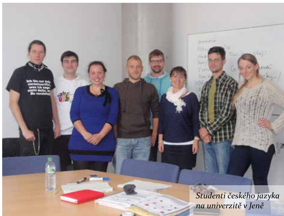
Studenti českého jazyka na univerzitě v Jeně