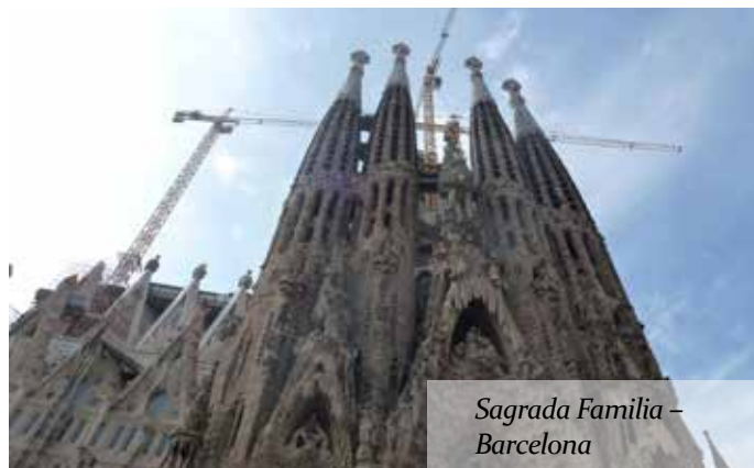
Sagrada Familia – Barcelona