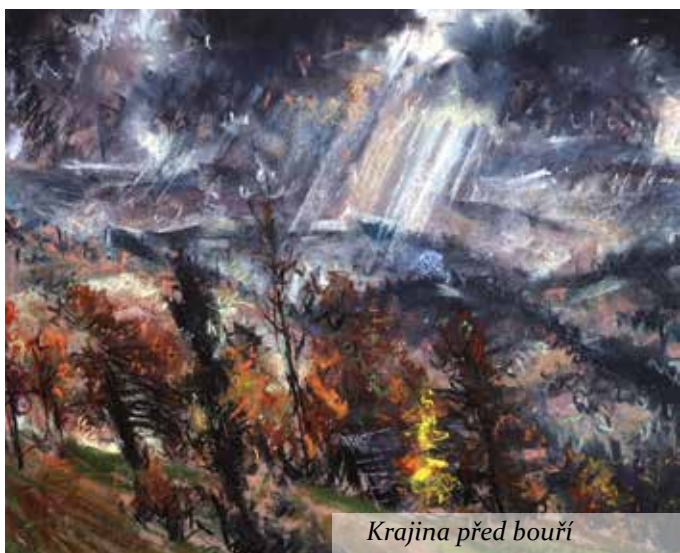
Krajina před bouří