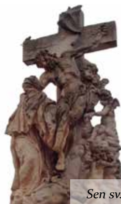
Sen sv. Luitgardy - kopie