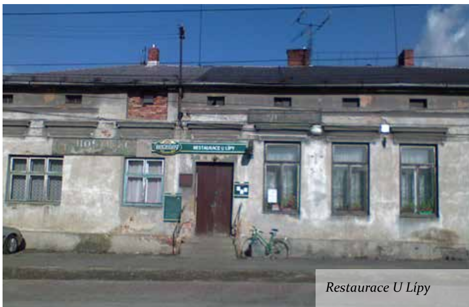
Restaurace U Lípy

Místo prý bylo vybráno panem děkanem podle toho, že v Hrabové se jubilant narodil a do stavení, kde je dnes restaurace U Lípy, prý chodil jako dítě cvičit na bradlech.