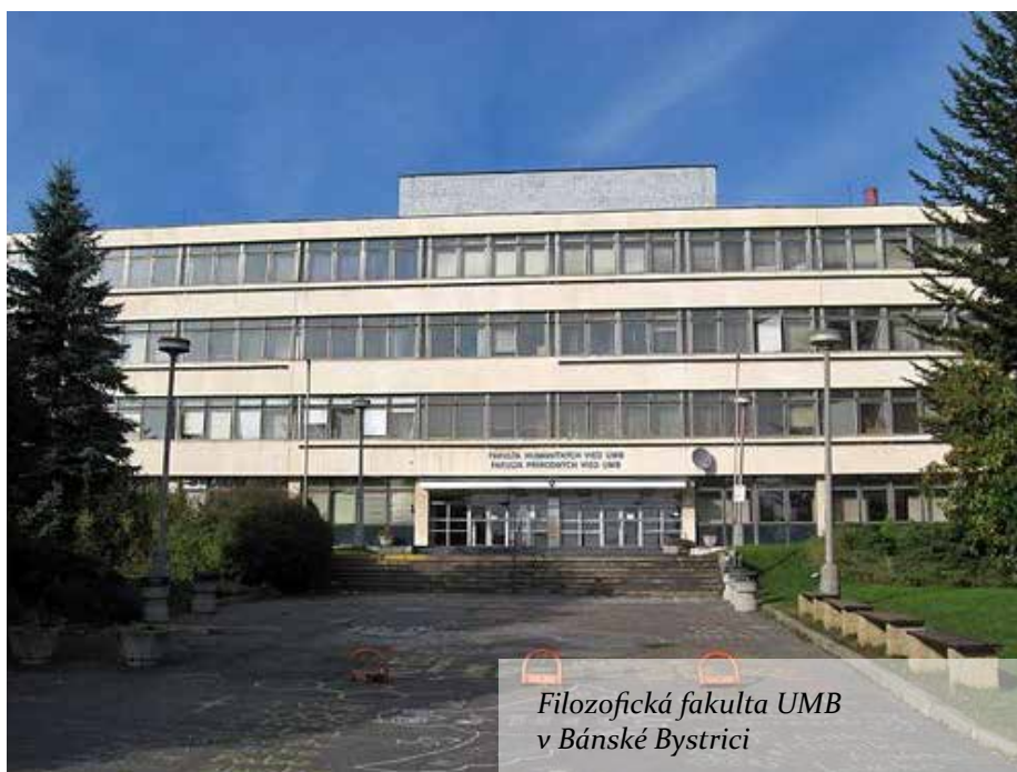
Filozofická fakulta UMB v Banské Bystrici