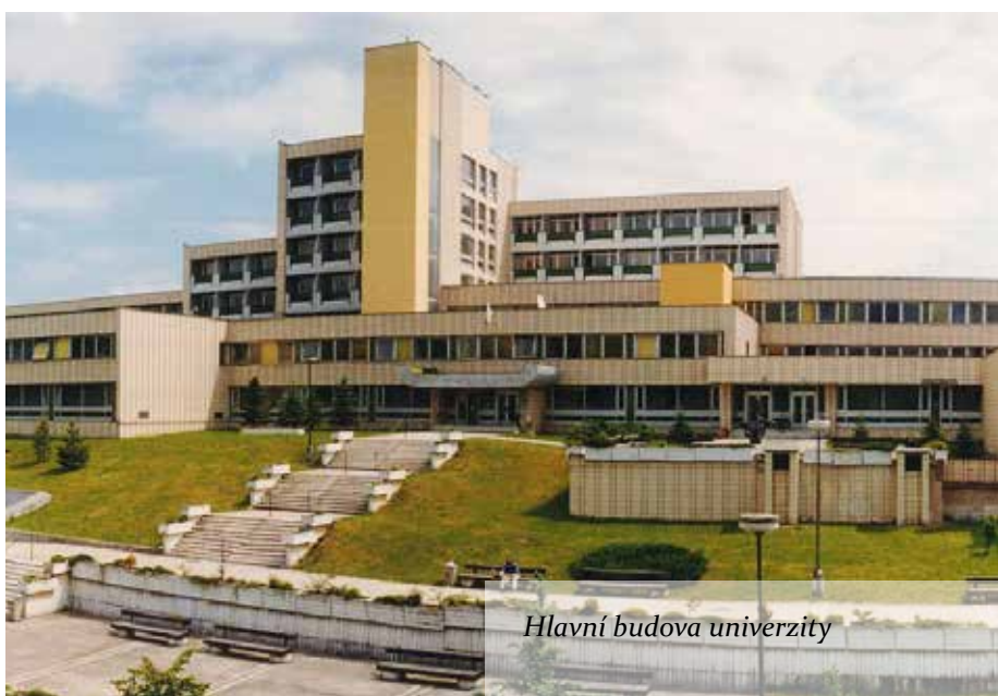
Hlavní budova univerzity