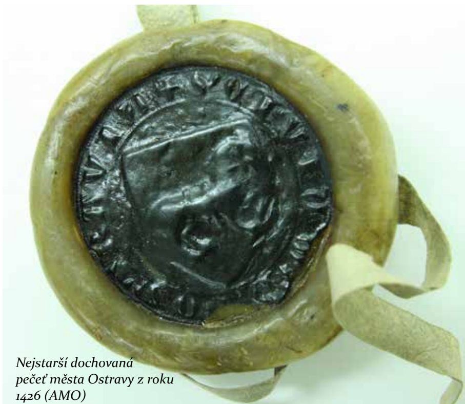
Nejstarší dochovaná pečeť města Ostravy z roku 1426 (AMO)