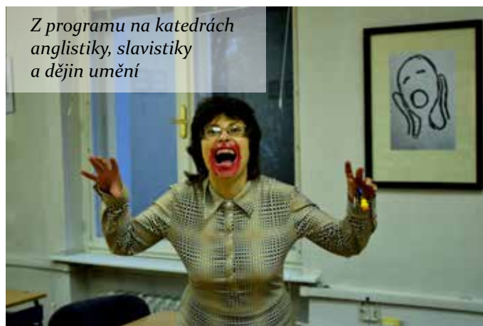
Z programu na katedrách anglistiky, slavistiky a dějin umění