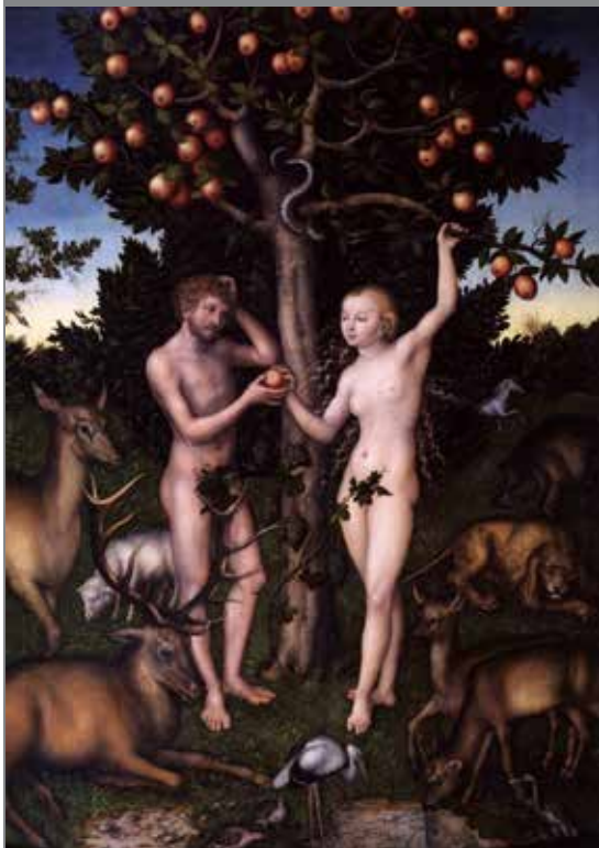
Adam a Eva