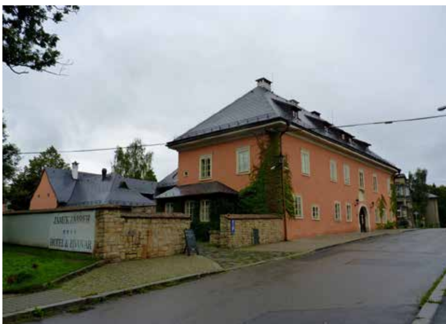
Zábřežský zámek dnes.

Další z incidentů se odehrál o Vánocích, kdy do zámku přišlo na koledu pět mladých dívek, „...a když vánoční písně zpívati počaly [...], tu ihned pan Mikuláš Orlík dveře zavřítí dal a tuze,