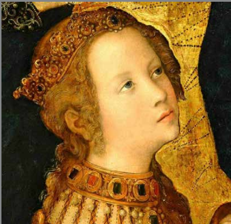
Pražský oltář - detail (Sv. Kateřina)