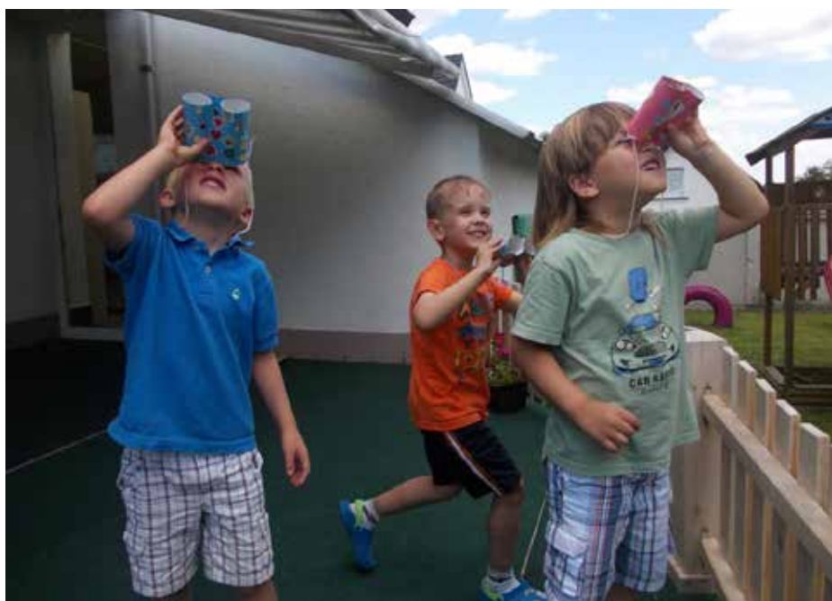
... a experimentovat

Dlouhodobě je naše školství umanuté a uvízle v podivně bezprizorním, konzervativním časoprostoru. Na jednu stranu jsou školy hojně dotovány evropskými penězi, nakupuje se drahé vybavení, nábytek, zatepluje se ostosest, učitelé jsou neustále školeni v nových přístupech a metodách, což samozřejmě opět platí EU, a na druhou stranu nikoho nezajímá, jaká je kvalita výuky, jak se pracuje s dětmi, které jsou mimořádné na obou pólech,