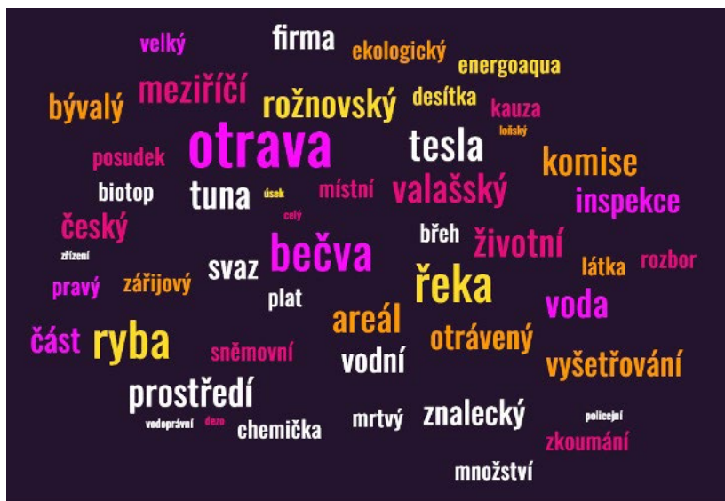
Obrázek 3: Wordcloud klíčových kolokací v souboru článků k tematice otravy řeky Bečvy z iDnes.cz. Klíčové kolokace byly pořízeny v programu Sketch Engine ( www.Sketch Engine.eu ), referenčním korpusem pro výběr klíčových kolokací je Czech Web corpus 2017 (csTenTen17). Klíčové kolokace byly lemmatizovány, word cloud byl pořízen v generátoru MonkeyLearn.

Informace, jež by vyzněly v neprospěch majitele média či politického hnutí ANO jsou v serveru iDnes.cz raději „opomenuty“, na rozdíl od serveru Seznam Zprávy zde tedy nedochází k porušování zásad informační kvality užitím expresivních či emocionálně příznakových výrazů, příspěvky na iDnes.cz ale neinformují v plném rozsahu (informace zamlčují); k tomu viz zaměření iDnes.cz na budoucnost (focusfuture) a Seznam Zpráv na minulost (focuspast).