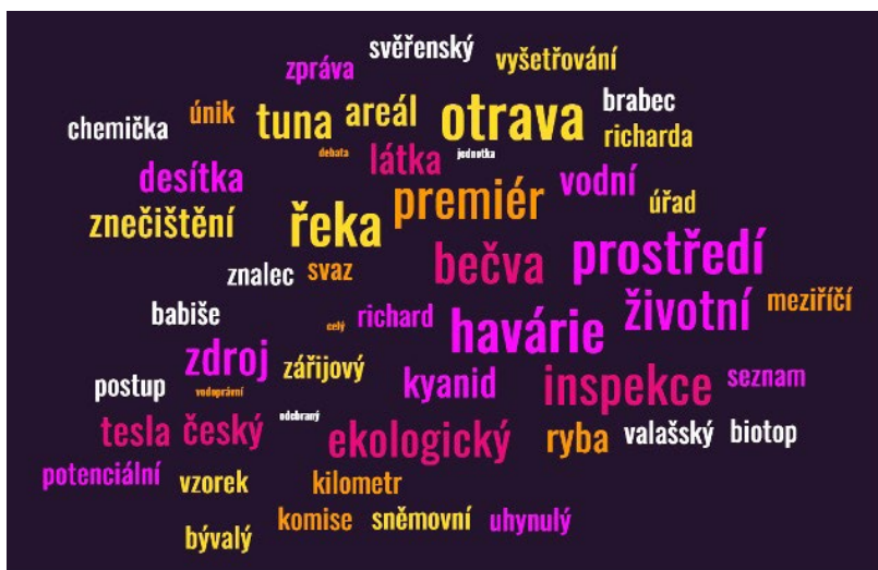
Obrázek 4: Wordcloud klíčových kolokací v souboru článků k tematice otravy řeky Bečvy ze Seznam Zpráv. Pro popis viz Obrázek 3.