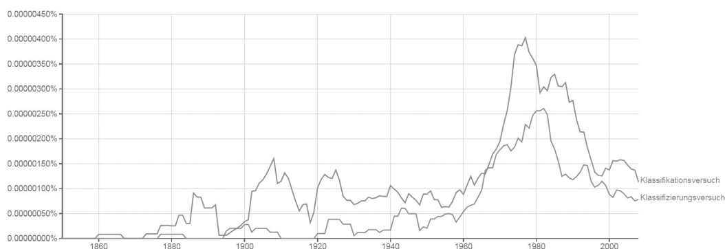
Abb. 1: Vergleich der Vorkommenshäufigkeit der Varianten Klassifikationsversuch / Klassifizierungsversuch in Google-Books mit Hilfe von Google Ngram Viewer, (Stand 10.07.2017).

In diesem Zusammenhang sollte ebenfalls die Tauglichkeit verschiedener Textkorpora für die Fragestellung bewertet werden. Beim Vergleich des Vorkommens solcher Parallelbildungen könnte auch das Recherche-Tool ‚Google Books Ngram Viewer‘ behilflich sein (s. URL 3), denn es ermöglicht uns, den Gebrauch entsprechender Parallelbildungen im Laufe der Zeit zu beobachten.