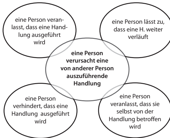
(Abbildung 3: Bedeutungen der Konstruktion lassen +Infinitiv)

Wegen ihrer hohen Produktivität sollte sie nicht nur als idiomatische Fügungen des Lexikons aufgelistet werden, sondern in das grammatische System des Deutschen eingeordnet werden.