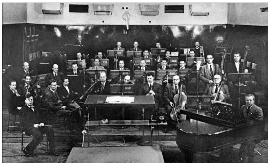
Moravskoostravský rozhlasový orchestr s dirigentem Jaroslavem Gotthardem.