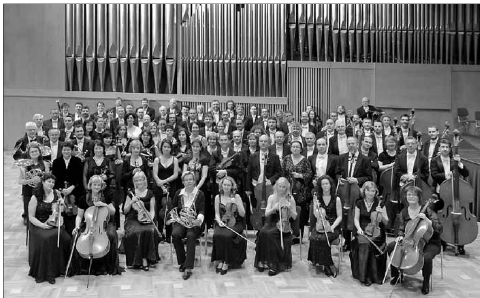
Členové orchestru Janáčkovy filharmonie Ostrava, Dům kultury města Ostravy, 2012.

Orchestr Radiojournalu 21 v Moravské Ostravě (tak zněl jeho původní název) vznikl hned po založení ostravské stanice v roce 1929 jako hudební těleso, kterému byl, stejně jako celé zdejší stanici, určen především lehký program ve všech jeho sociálních odstínech, od venkovské kapely hornické až po velkoměstský mondénní jazz . 22 V čele původně šestnáctičlenného orchestříku stál kapelník a tzv. referent hudebního vysílání Bohuslav Tvrdý. Ve 30. letech se orchestr rozrostl na 36 hráčů, kteří každodenně v živém vysílání účinkovali s Bohuslavem Tvrdým, Janem Plichtou, Vlastimilem Musilem, Františkem Divišem i hostujícími dirigenty, jako byli Otakar Jeremiáš, Antonín Devátý, Alois Klíma, Karel Boleslav Jirák, Rudolf Kubín, Anton Aich, Jaroslav Vogel, František Jílek, Břetislav Bakala a další. Po válce byl v čele orchestru Jaroslav Gotthard. Ačkoliv se mělo toto rozhlasové těleso původně zaměřovat jen na lehké hudební žánry, např. na charakteristické skladby či směsi z oper a operet, neboť na studium závažnějších děl nebyl v každodenním provozu prostor, byli všichni hráči pro svoji všestrannost a pohotovost velmi žádanými „výpomocemi“ v ostatních ostravských orchestrech, kde často hráli i velmi náročný repertoár. Když například roku 1953 založil operní šéf Rudolf Vašata Ostravský komorní orchestr, bylo toto těleso složeno jak z hráčů divadelního, tak i rozhlasového orchestru.