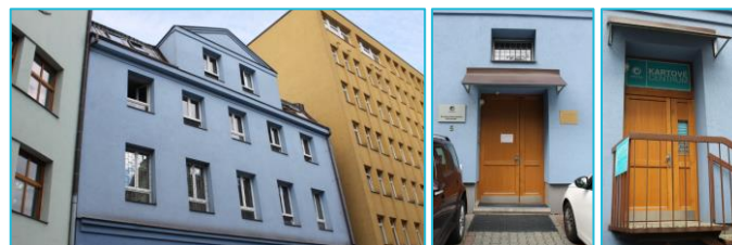
Zleva: budova CIT, vchod CIT, vchod Kartového centra

Fotografování studentů a okamžitý tisk karet probíhá od 1. 9. 2020 na Kartovém centru, které je umístěno v budově CIT (Bráfova 5) v místnosti č. 103 (Kartové centrum).