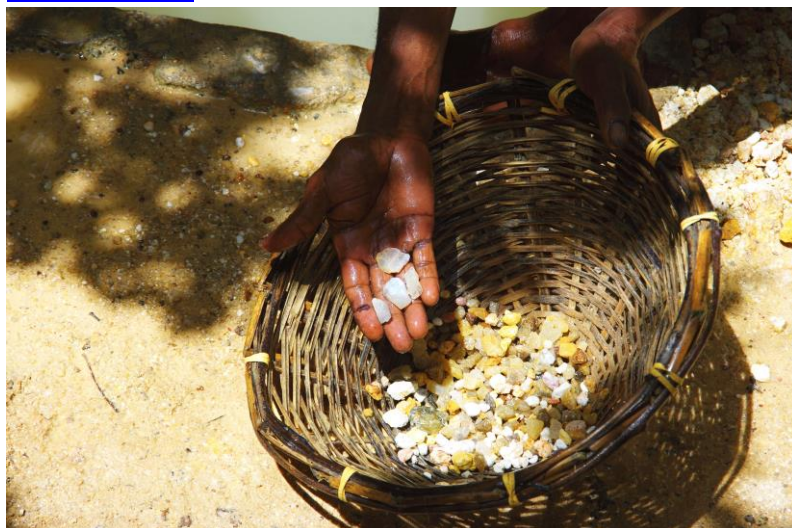
Výsledek – měsíční kámen